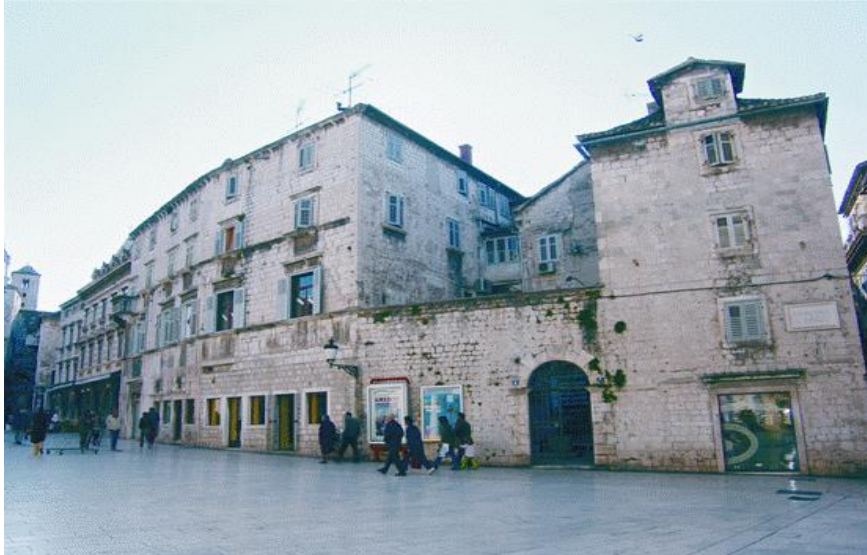
Slika 13. Kuća Pavlović na Pjaci