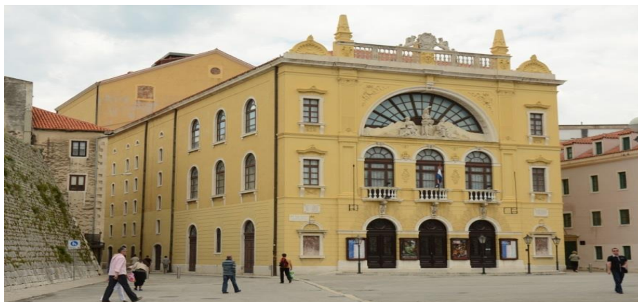
Slika 11. Hrvatsko narodno kazalište u Splitu