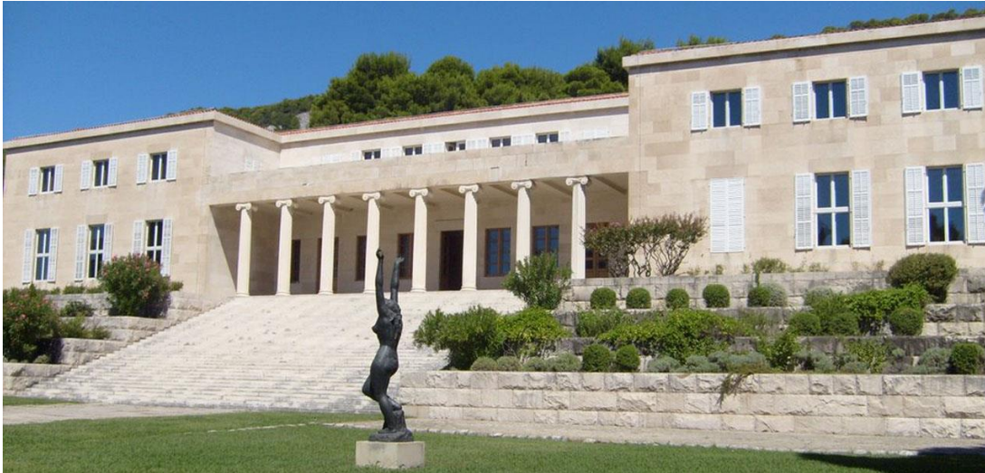
Slika 7. Galerija Meštrović