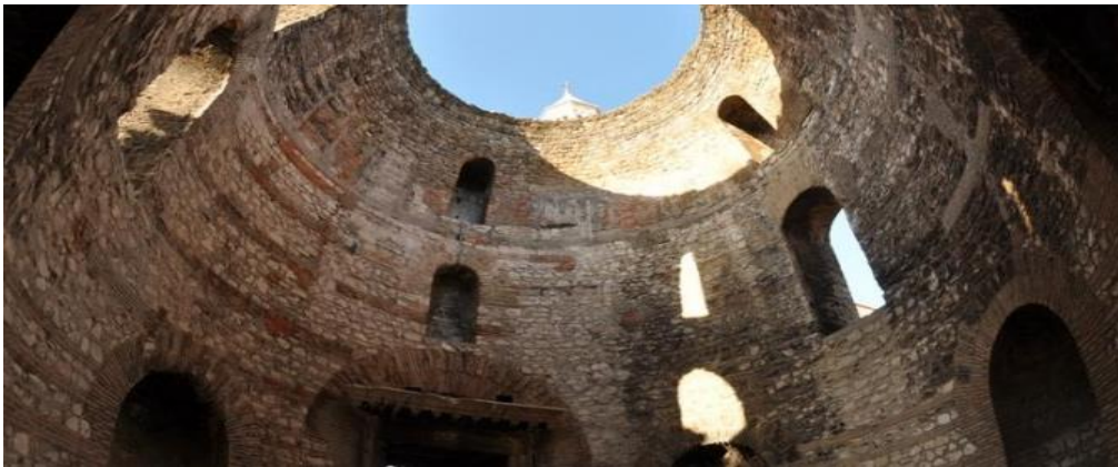
Slika 4. Vestibul