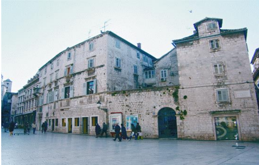
Slika 13. Kuća Pavlović na Pjaci