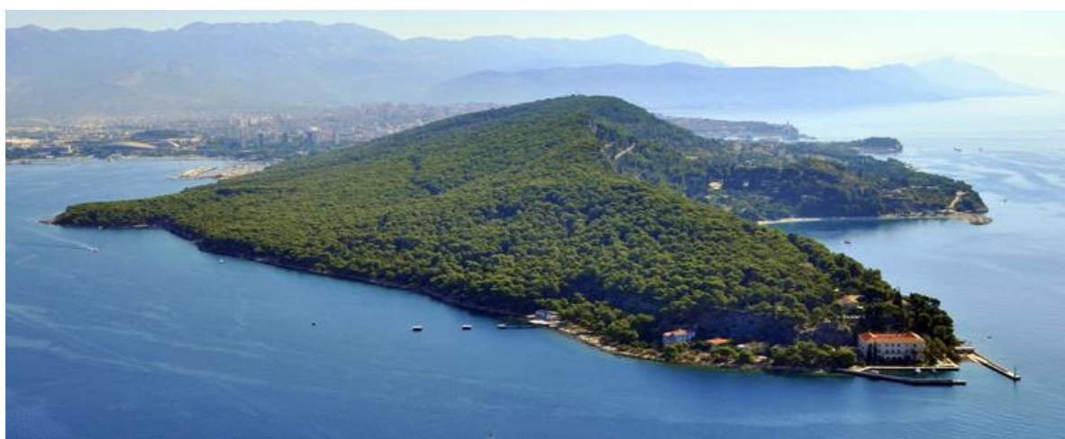
Slika 15. Park-šuma Marjan