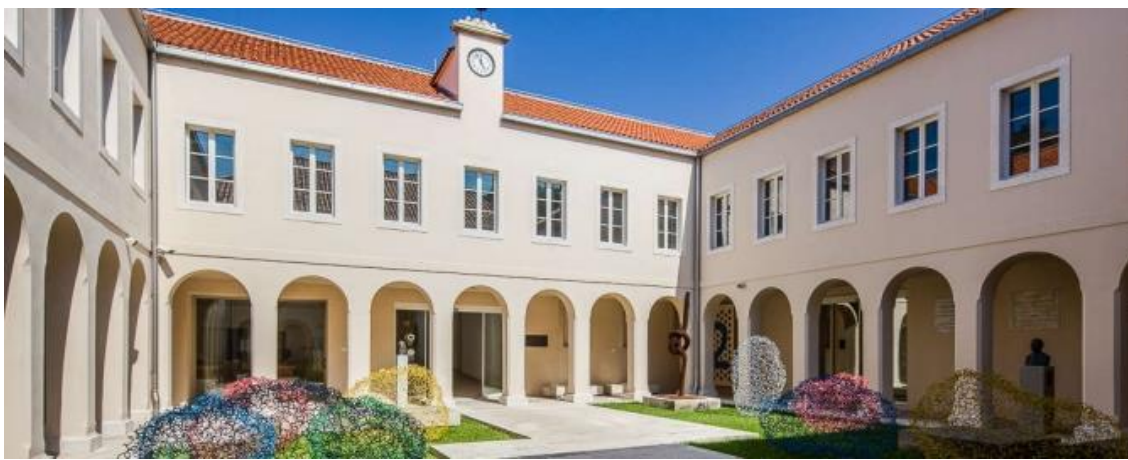
Slika 9. Galerija umjetnina Split