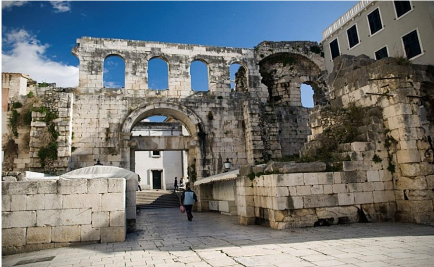
Slika 6. Srebrna vrata