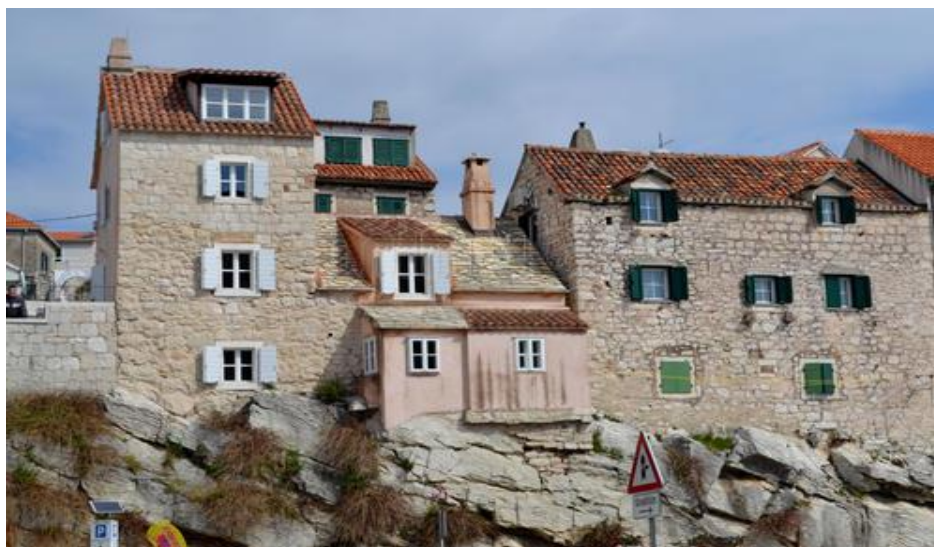
Slika 12. Veli varoš