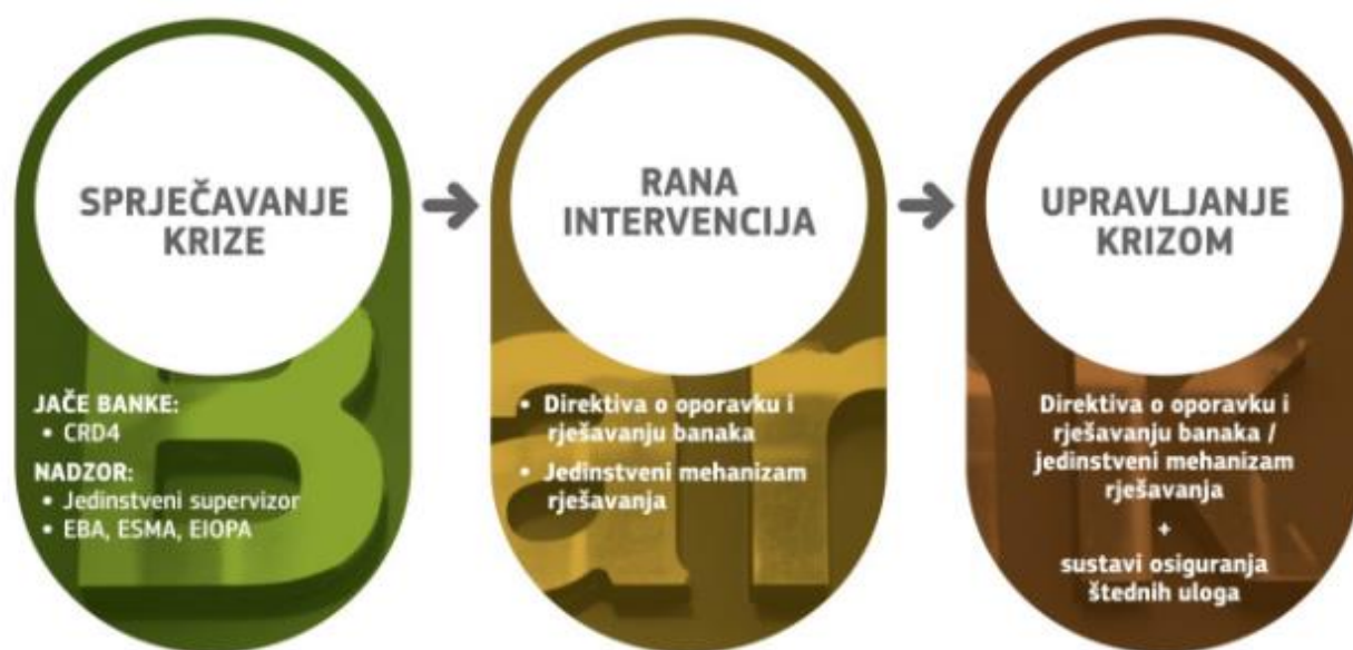
Slika 2: Stvaranje sigurnog bankarskog sektora

Stoga je cilj Europske bankarske unije stvaranje sigurnijeg bankarskog sektora na području Europske unije. Cilj je osigurati da sve banke budu sigurnije, da se osigura intervencija supervizora te da se osiguraju mehanizmi za upravljanje krizom. Preciznije, to su tri cilja prikazana na sljedećoj slici.