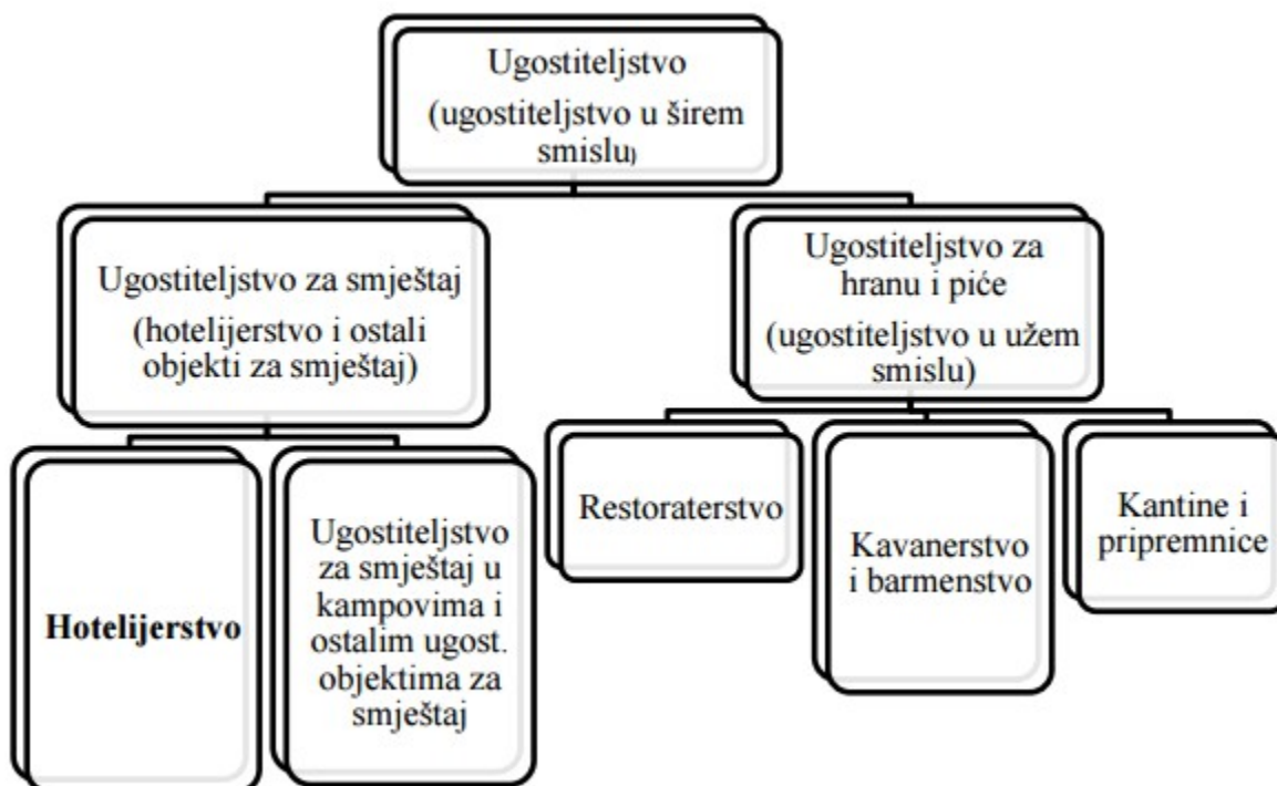
Slika 1: Gospodarska djelatnost ugostiteljstva

Ugostiteljstvo, kao gospodarska grana ljudske aktivnosti, dio je turističkog gospodarstva gdje se pružaju usluge smještaja i usluge prehrane, pića i napitaka. Prema Zakonu o ugostiteljskoj djelatnosti definicija ugostiteljstva glasi: ugostiteljska djelatnost je pripremanje i usluživanje jela, pića i napitaka i pružanje usluga smještaja, kao i pripremanje jela, pića i napitaka za potrošnju na drugome mjestu, sa ili bez usluživanja (u prijevoznom sredstvu, na priredbama i slično) i opskrba tim jelima, pićima i napitcima (catering) (Zakon o ugostiteljskoj djelatnosti).