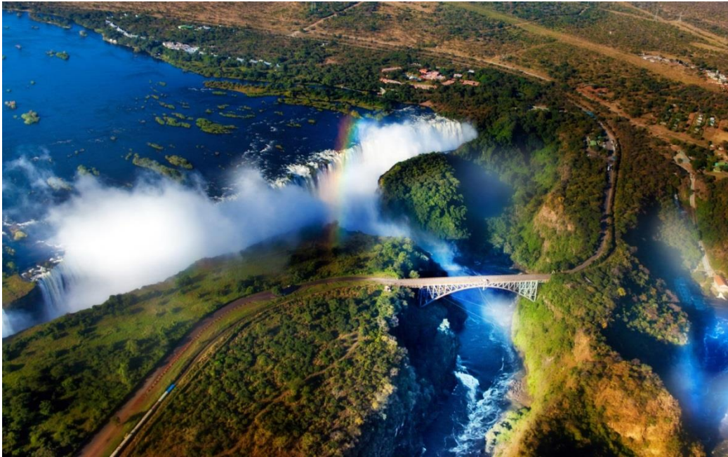
Slika 3: Viktorijini slapovi na rijeci Zimbabve

Najpoznatije destinacije avanturističkog turizma u svijetu svakako su: Viktorijini slapovi na rijeci Zimbabve, južna Afrika, kanjon rijeke Colorado u SAD-u, Alpska područja u Europi, Nepal, Istočna Azija i Pacifik. Od novijih turističkih destinacija koje svoju turističku ponudu baziraju na avanturističkim aktivnostima posebno se ističu otočje Fidži, Cairns u Australiji, Queenstown na Novom Zelandu, Costa Rica te Antartika. Osim navedenih destinacija, u svijetu se pojavljuje sve veći broj destinacija koje ponudu avanturističkih aktivnosti nude kao svoj primarni turistički proizvod ili kao dodatnu atrakciju za povećanje konkurentnosti na globalnom tržištu. Na ovaj način omogućuju turistima dodanu vrijednost i povećavaju cjelokupnu kvalitetu ponuđenih proizvoda.