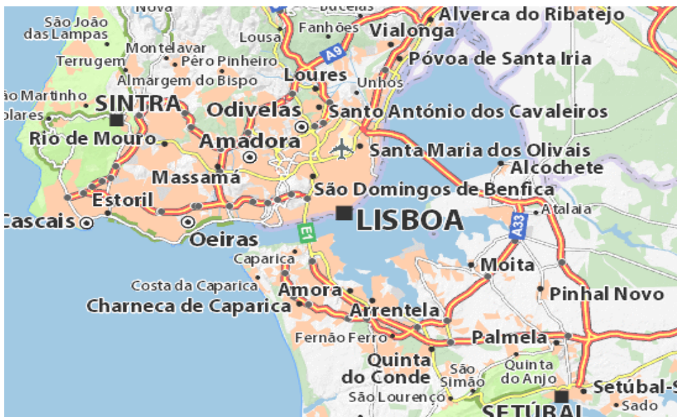
Slika 8. Karta Lisabona i okolice

Središnji fokus ove regije je Tagus, najveća rijeka na Iberijskom poluotoku. Lisabon je europski glavni grad koji se nalazi na ušću Tagusa. Setubal poluotok nalazi se na ušću rijeka Tagus i Sado. Njegova okolina nudi nevjerojatnu raznolikost turističkih atrakcija, od bajkovitih palača u jednom od najromantičnijih europskih gradova (Sintra), do svjetske klase golfa i zabave u najvećem europskom casinu u Estorilu, surfanja u Cascaisu ili bijeg u park prirode u Arrábidi, te promatranje dupina u Setúbalu. Na sjeveru Lisabona nalazi se "salioia" (ruralno) područje, portugalska Estremadura koja je ispunjena liticama, plažama i zanimljivim malim gradovima. Lokalno gospodarstvo sastoji se od poljoprivrednih i uslužnih djelatnosti. Obala oko Lisabona pruža savršene uvjete za vodene sportove kao što su surfanje i jedrenje na dasci (Jackson i Hudman, 2014:298). Zračna luka u Lisabonu je povezana dobro razvijenom cestovnom i željezničkom mrežom koja povezuje zračnu luku s ostatkom zemlje. Ono što mnogi ljudi ne zna je da je prosječna godišnja količina padalina u Lisabonu ista kao u Londonu. Jedina razlika je u tome što u Londonu kiša pada tijekom cijele godine, a u Lisabonu je to samo ponekad. Široka raznolikost krajolika i baštine uvijek je blizu, bilo na sjeveru ili južnoj strani glavnog grada. Uz obalnu cestu pronaći ćete plaže i odmarališta koja kombiniraju vile i hotele s početka 20. stoljeća s marinama, terasama i odličnim golf igralištima.