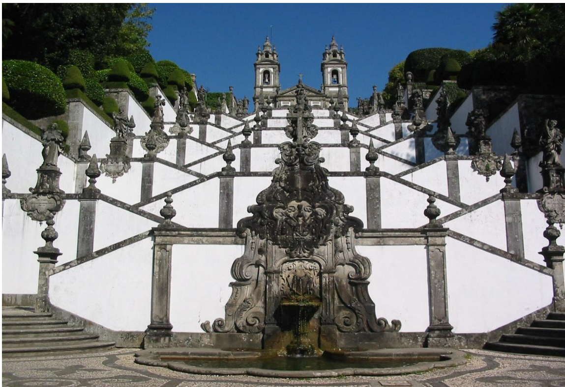
Slika 4. Crkva Bom Jesus do Monte i stubište

te Muzej Tesouro da Sé. U crkvi Bom Jesus do Monte (19.st.); nalazi se stubište koje vodi do vrha sadrži 17 odmorišta ukrašenih simboličnim fontanama, alegorijskim kipovima i drugim baroknim stilskim ukrasima uz teme kao što su Postaje križa, Pet osjetila, Vrline, Mojsije prima zapovijedi, a na vrhu osam biblijskih figura koje su pridonijele Isusovoj osudi. Od suvremenih znamenitosti ističe se gradski stadion Braga, kojeg je dizajnirao Souto Moura, izgrađen je za Euro 2004. godine (Visit Portugal, https://www.visitportugal.com/en/ ). S obzirom na činjenicu da Braga ima gotovo četrdeset mjesta bogoslužja, lako je vidjeti zašto je ovaj barokni grad, poznat kao čvrsta, destinacija vjerskog turizma. Zahvaljujući velikom broju studenata i stalanom priljevu mladih portugalaca, Braga ima neke živahne kulturne ponude, uglavnom podzemnu bar scenu. Dodatnu avanturu na otvorenom u neposrednoj blizini - nacionalni park Gerês. Bragin lagani ritam života ubrzava se poslije mraka, osobito u središtu grada. Poput mnogih sveučilišnih gradova, Braga ima kreativnu energiju koja okuplja sve vrste ljudi, nadilazeći dob, klasu i životni stil.