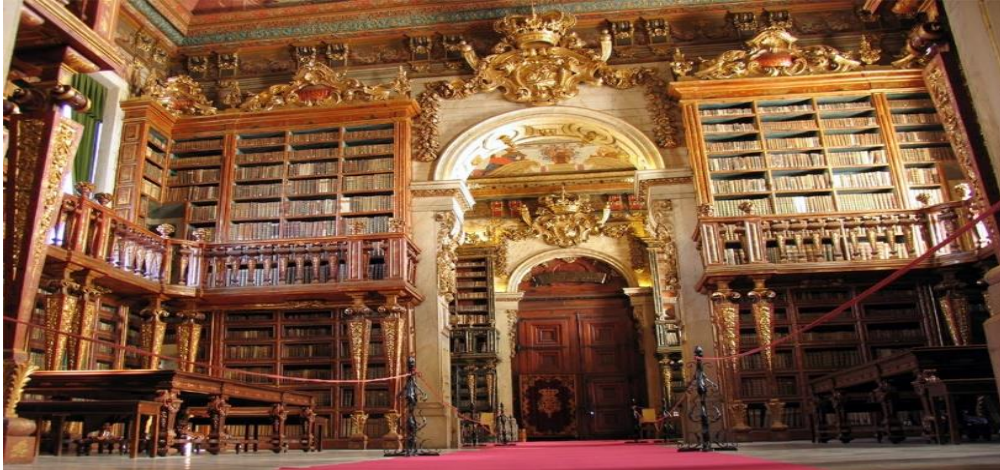
Slika 6. Joanine knjižnica

Joanine knjižnica koja ima više od 300000 radova iz 16. do 18. stoljeća koji su raspoređeni u prekrasnim pozlaćenim policama. Zgrade zauzimaju mjesto palače u kojoj su živjeli prvi kraljevi Portugala, kada su grad proglasili glavnim gradom kraljevstva (Visit Portugal, https://www.visitportugal.com/ ).