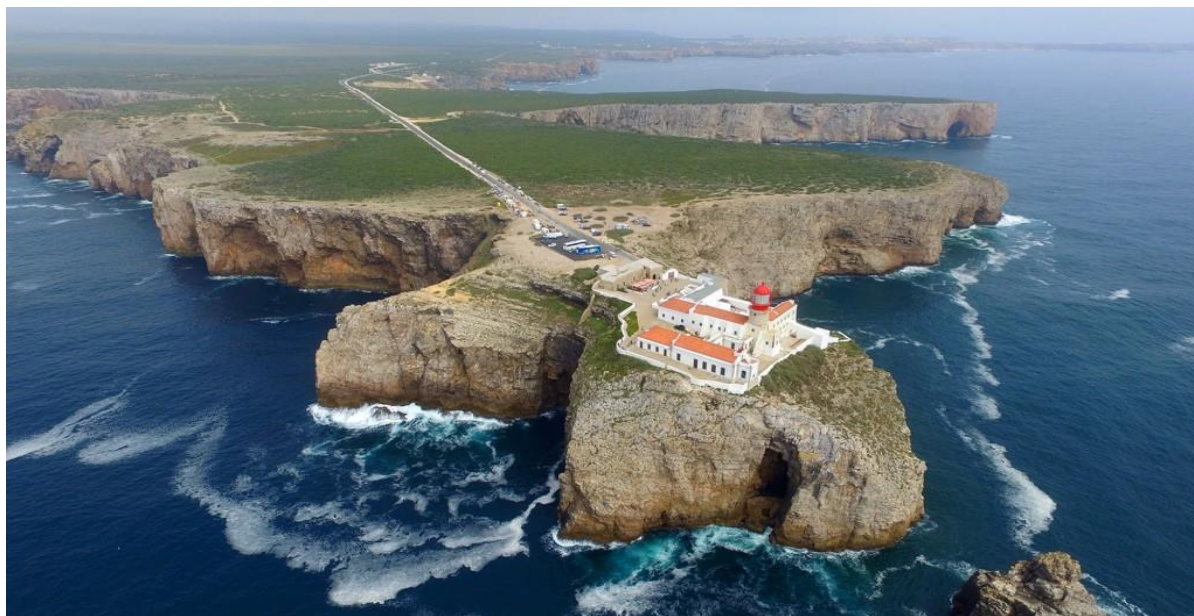
Slika 15. Rt Svetog Vincenta, Sagres

Sagres je savršen za biciklizam, jedrenje na dasci, ronjenje i općenito da se doživi Algarve koja još uvijek nije pod utjecajem turizma. Surfanje je glavna aktivnost Sagresa, ali ima i izazovne pješačke staze, a udaljavanjem od luke ribarstvo (Sagres uncovered, http://www.sagresuncovered.com/ ).