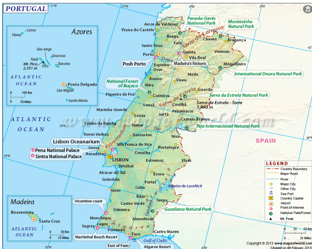
Slika 1. Karta Portugala