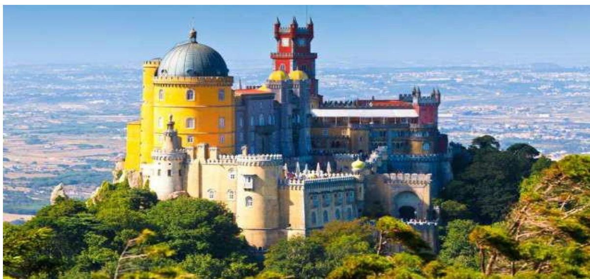
Slika 12. Palača Pena, Sintra