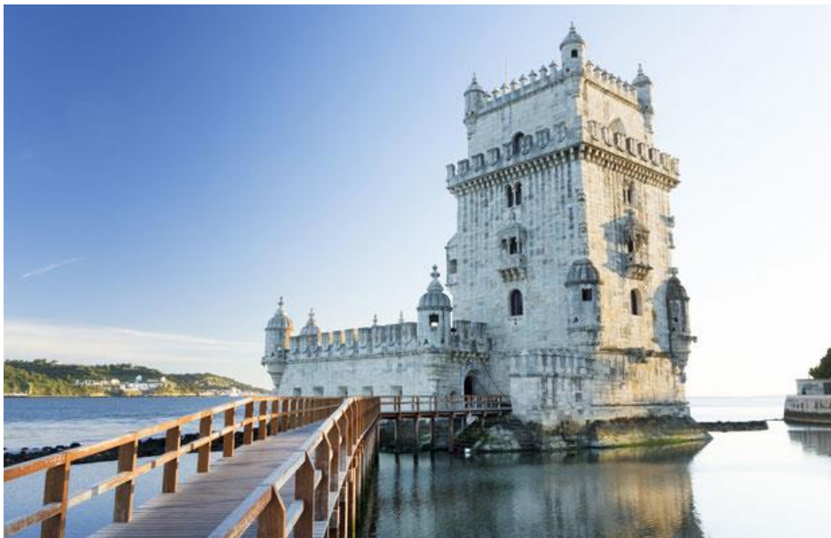
Slika 10. Kula Belém, Lisabon