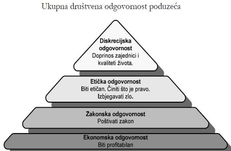
Slika 5. Hijerarhija društvene odgovornosti poduzeća (Daft, 1997, 154)

Razlikujemo četiri razine društveno odgovornog poslovanja koje imaju svoju hijerarhiju i dijele se ovisno o njihovoj veličini i tome koliko im često menadžeri pristupaju prilikom donošenja poslovnih odluka. 64