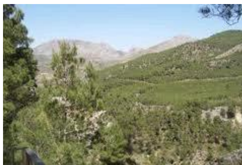
Slika 7. Pejzaž Andaluzije

Za izgled pejzaža, razvoj niza prirodnih procesa i života ljudi na Zemlji, od posebnog je značaja biosfera. Ona obuhvaća prirodni pedološki pokrivač, biljni svijet na njemu i cjelokupni životinjski svijet. Biosfera ima naglašene zonalne i azonalne specifičnosti i kao takav predmet je proučavanja niza znanstvenih disciplina i interesantna za brojne aplikativne djelatnosti. Kao izvor kisika, modifikator klime, proizvođač organske materije i osnova ljudske prehrane, ispoljava se i kao direktna i indirektna turistička vrijednost. Ima naglašena rekreativna, estetska, zdravstvena, kuriozitetna, endemska i znamenita svojstva turističke privlačnosti. Omogućuje neke specifične vrste turizma.