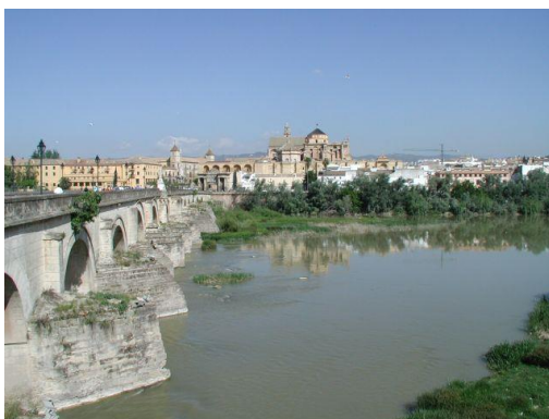
Slika 3. Guadalquivir u Kordobi

Guadalquivir je najduža rijeka u Andaluziji (657 km) i peta najduža rijeka na Pirinejskom poluotoku. Ime potiče od arapske riječi Al Vadi al-Kabir što znači "Velika rijeka". Izvire u Sierra de Cazorla, prolazi kroz gradove Kordobu i Sevilju, i ulijeva se kod Sanklar de Barameda. Slijev rijeke zahvaća oko 58000 km 2 . Njezine glavne pritoke su Genil i Guadiana Menor te Guadalimar, Guadiato i Bembézar.