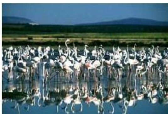
Slika 13. Nacionalni park Donjana

Upisan na UNESCO listu 1994. godine. Zauzima desnu obalu rijeke Guadalquivir i njeno ušće u Atlanski ocean. Ovaj nacionalni park je jedan od najvažnijih prostora teritorija Andaluzije i najveći ekološki rezervat Europe. Značajan je zbog velikog broja jezera, šuma i močvara. U njemu živi pet vrsta ugroženih ptica (npr. Carski orao – Aguila imperial ). Park je priznat na internacionalnom nivou od strane Međunarodnog savjeta za suradnju programa Man and UNESCO sa ciljem da promovira i pokaže ravnotežu prirode i čovjeka.