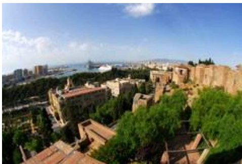
Slika 18. Alkazaba (Alcazaba)

Tvrđava datira iz VIII. vijeka, iako veći dio njene strukture pripada polovini XI. vijeka. Ulazi se na vrata poznata kao Kristova vrata ( Puerta del Cristo ), gdje se proslavila prva misa kada su kršćani osvojili Malagu. Tvrđava posjeduje jedan od najvećih maurskih vojnih muzeja u Španjolskoj. Bila je sastavni dio odbrambenog zida arapske Malage sa 30 kula i 20 vrata među kojima su Puerta de Bóveda ili Puerta de las Columnas i povezana sa zidinama grada, koji su sada nestali.