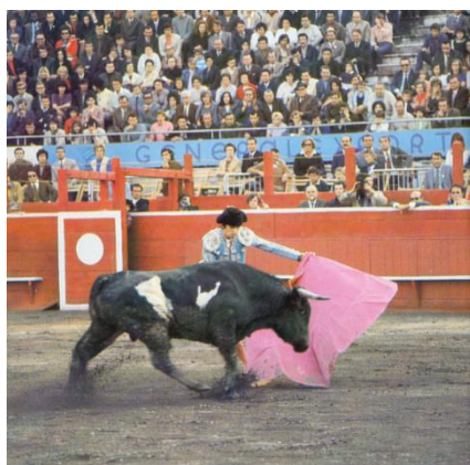
Slika 32. Korida

Borba sa bikovima je prava umjetnost u kojoj bik nimalo nije žrtva. Bikovi za borbu ( toro bravo ) se posebno uzgajaju, imaju pažljivo birano podrijetlo, jedu najbolju hranu i niko ih ne smije plašiti. Matador ima 80 kilograma, sjajni kostim, plašt i jedan mač, a bik 500 kilograma, dva oštra roga i prijeku narav!