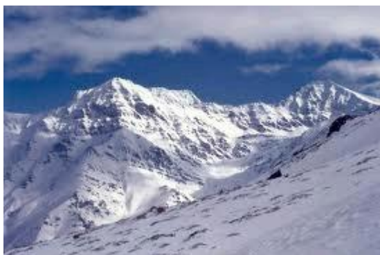
Slika 10. Andaluzijsko Gorje