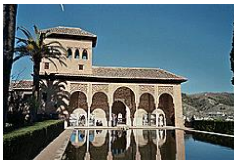
Slika 17. Alambra

Upisani su na UNESCO listu 1984. godine. Alambra je dvorac i utvrđenje maurskih vladara u Granadi u južnoj Španjolskoj koje je izgrađeno u XIII. i XIV. vijeku. Utvrđenje se nalazi na brdskoj zaravni u jugoistočnom dijelu grada Granade. Dvorac i utvrđenje su nekada bili sjedište muslimanskih vladara Granade, a danas su jedna od najvećih turističkih atrakcija Španjolske. Alambra je najčuvenije djelo islamske umjetnosti na tlu Španjolske i jedini dvorac iz doba maurskih vladara koji je gotovo nedirnut. Danas su na zgradama i baštama vidljive jedino sitne prepravke katoličkih vladara iz XVI. vijeka i kasnije. Heneralife 15 je bio ljetni dvorac mavarskih sultana Al-Andaluza. Albajsin 16 je četvrt u gradu Granadi u kojoj se nalaze krivudave uličice iz perioda mavarske vladavine Granadom. Nalazi se na uzvišenju koje gleda na Alambro i mnogi turisti odlaze u Albajsin da bi imali dobar pogled na utvrđenje Alambre.