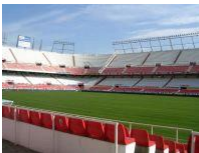
Slika 34. Stadion Seville: Ramon Sanchez Pishuan

Što se tiče najvažnije sporedne stvari na svijetu, nogometa, izdvaja se nogometni klub Sevilla. Stadion Seville Ramon Sanchez Pishuan (Estadio Ramón Sánchez Pizjuán) je osnovan 1958. godine i ima kapacitet od 45.500 mjesta. Samim tim što je bio domaćin finala Kupa europskih šampiona 1986. godine, polufinala Svjetskog prvenstva 1982. godine, kao i time da Španjolska reprezentacija igra jedan dio svojih utakmica na ovom stadionu, od svih kolektivnih sportova u Andaluziji ovaj stadion privlači najveći broj kako domaćih tako i stranih turista.