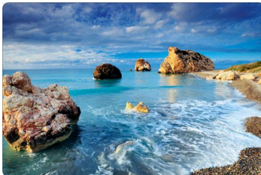
Slika 5. Detalj Sredozemnog mora

Karakteristike Sredozemnog mora koje su značajne za razvoj turizma su intezivno plava boja mora, prozirnost koja iznosi 32-60 m, a koja posebno pogoduje ronjenju, podvodnom ribolovu i podvodnom promatranju živog svijeta, i temperature vode koja je u kolovozu od 22 0 do 25 0 C, što je značajno za rekreativni turizam.