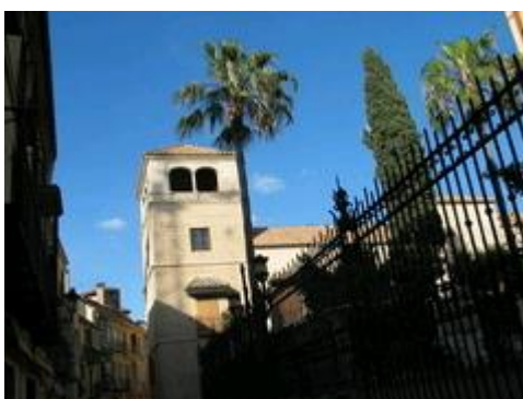
Slika 30. Picasso muzej