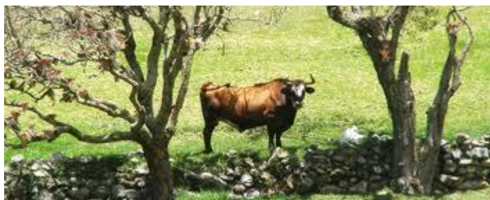
Slika 9. Flora i fauna Andaluzije – Zahara de los Atunes

Ljeti je znatno drugačije, jer uz stalno vedro nebo i visoku temperaturu, vegetacija uglavnom požuti, a u prvi plan dolaze ogoljeni kameni blokovi (sipari). Neki dijelovi Andaluzije, u takvim uvjetima, imaju oskudnu stepsku vegetaciju. Sredozemnu obalu karakterizira raznolikost, koja je uglavnom proizvod ljudskog rada, odnosno radi se o kultiviranim biljnim vrstama (agrumi, masline, vinova loza, povrće, čak i palme, i drugo). U sredozemnim klimatsko-vegetacijskim uvjetima živi mediteranska fauna, koju karakterizira veliki broj gmazova, insekata i ptica, dok su se krupnije životinje održale uglavnom u planinskim predjelima.