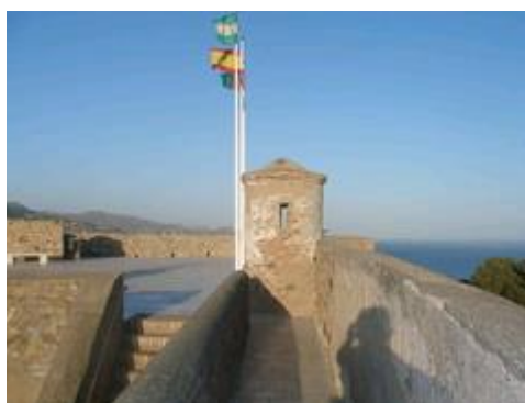
Slika 25. Zamak Gibralfaro (Castillo Gibralfaro)

12. Zamak Gibralfaro (Castillo Gibralfaro) je srednjovjekovni dvorac u Španjolske. Smješten je u povijesnom gradu Malagi, na 130 metara visokom brijegu. Zajedno s tvrđavom Alcazaba dominira gradom.