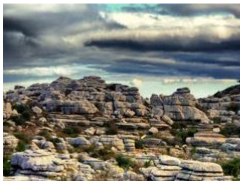
Slika 11. Torsal de Antekera