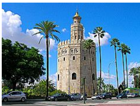
Slika 24. Zlatna kula (Torre del Oro)

11. Zlatna kula (Torre del Oro) je smještena u prekrasnom povijesnom gradu Sevilli.