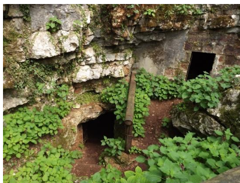
Slika 12. Pećina u Nerhi

Otkrivena je 1959. godine od strane lokalnog stanovništva. Ova poznata pećina proglašena je najljepšom pećinom Europe. Unutar pećine pronađene su stare zidne slike iz doba paleolitika. Svake godine ovdje se održavaju međunarodni festivali koji okupljaju najbolje zabavljače iz cijelog svijeta.