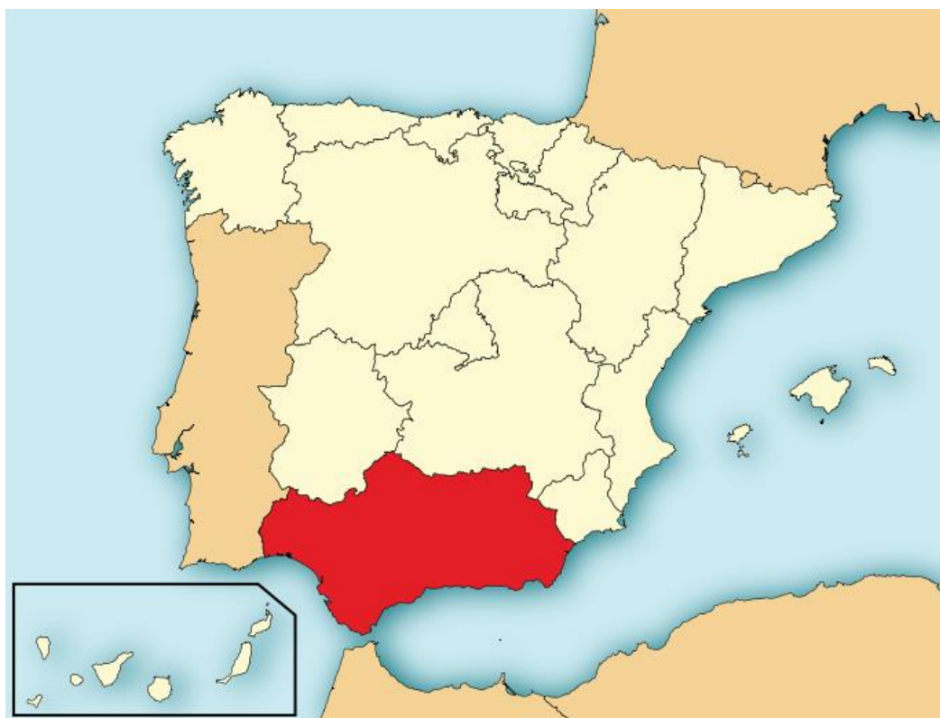
Karta 1. Geografski položaj Andaluzije u Španjolskoj

Teritorija Andaluzije obuhvata 17,3% ukupne teritorije Španjolske (87.268 km 2 ) što je više nego površina nekih zemalja kao što su Belgija, Nizozemska, Danska, Austrija ili Švicarska.