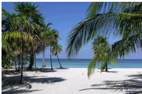
Slika 8. Detalj mediteranske vegetacije Andaluzije

Obalni dio Andaluzije odlikuje mediteranska vegetacija, a u ostalom dijelu prevladavaju šume, naročito na vlažnijem sjeveru, gdje najviše ima hrasta plutnjaka. Mediteransku vegetaciju karakteriziraju plantaže naranči, limuna, maslina, šećerne trske, duda, riže. U sredozemnom dijelu očuvane su hrastove šume u nižim dijelovima i borove šume, među koje spada i čempres - simbol mediteranskog pejzaža.