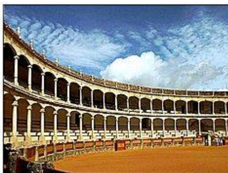
Slika 27. Arena bikova u Rondu

Izgradnja Arene je započeta 1779. godine a završena je 1785. godine. Nakon samog otvaranja, Arena je postala naširoko poznata zahvaljujući toreadorskoj porodici Romerovich . Najveći toreador ove porodice, Pedro Romero , borio se uspješno u Areni s više od 5.000 bikova bez ozljeda.