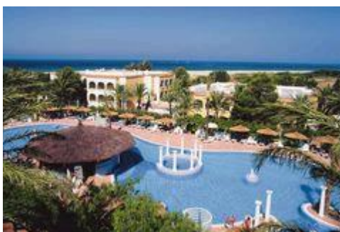
Slika 35. Atlantera

- Montenmedio Dehesa Golf Club Costa de la Luz . Prednost Centra je blaga klima, zahvaljujući kojoj je moguće izvoditi većinu sportskih aktivnosti tokom cijele godine.