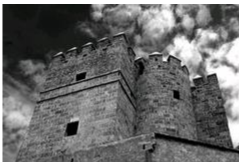
Slika 19. Torre de la Calahorra