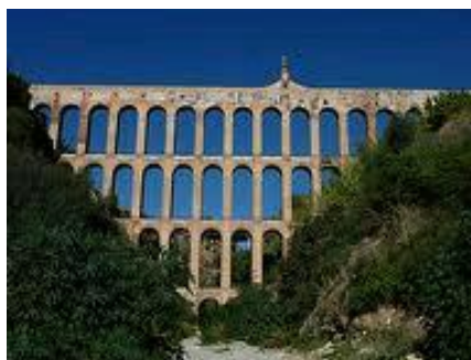
Slika 28. Orlo Akvadukt ( Aguila Aquaduct )

15. Orlovski Akvadukt ( Aguila Aquaduct ) je veličanstveni akvadukt u Španjolskoj. Smješten je u regiji Obala sunca ( Costa del Sol ), u neposrednoj blizini jedne od glavnih magistrala Španjolske N-340, koji dovodi u Nerju (provincija Malaga), prekrasno mjesto za odmor.