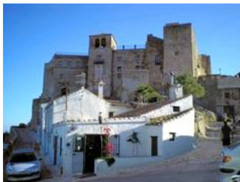
Slika 23. Dvorac Castellar (Castillo de Castellar)

su u uskim ulicama kućice okrečene jakim bojama i ukrašene sa pregrštom šarenog cvijeća, što predstavlja snažan kontrast zidinama dvorca.