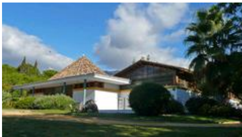
Slika 29. Muzej Bonsai (Museo del Bonsai)

ljekaru Maíz Viñalsu . Muzej ima više od 300 različitih vrsta bonsaia, koji se smatraju najboljom zbirkom u Europi. U Muzeju se može vidjeti preko 40 vrsta bonsaia iz svih krajeva svijeta. Muzej sadrži i jedinstvene zbirke drveće od kojih su neki stari i preko 300 godina. Smatra se da Muzej sadrži najbolju zbirku divljeg drveća na svijetu. 26