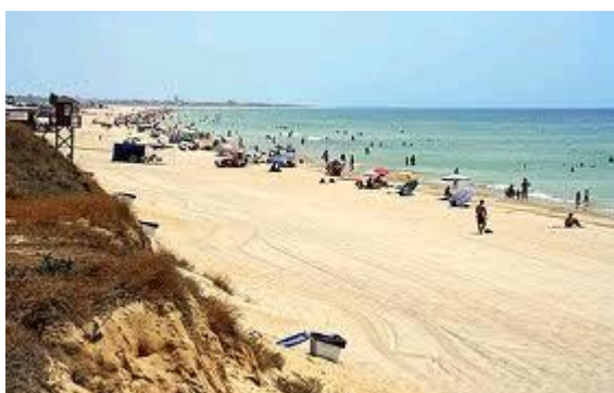
Slika 6. Costa de la Luz

Costa de la Luz (Costa de la Luz) je dio andaluzijske obale na Atlantiku, koja se proteže od Tarifa na jugu, duž obale pokrajine Cadiz i provincije Huelva, do ušća rijeke Gvadiana. Ovaj dio Atlanskog oceana u posljednjih nekoliko godina je postao više popularan sa stranim posjetiteljima, posebno Francuzima i Nijemcima. Osim plaža i sunca, postoje velike mogućnosti i sadržaji za slobodne aktivnosti, kao što su golf, veslanje i druge sportove na vodi. Costa de la Luz posebno je poznata po ljepoti svojih zaštićenih prirodnih rezervi i broj prvoklasnih prirodnih atrakcija.