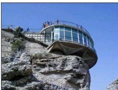
Slika 36. Balkon Europa

2. Balkon Europa je fenomenalno mjesto u Nerji, u blizini Costa del Sol . Smješten je na vrhu hridi nad morem, na mjestu bivšeg dvorca. Izgradnja je počela 1487. godine na ruševinama dvorca sagrađenog u IX vijeku. Već u XV vijeku privlačio je veliki broj posjetioca svojim prekrasnim pogledom na veliki dio Obale Sunca. Ljepotu ovog mjesta opisuju fotografije koje nemaju potrebe za komentar.