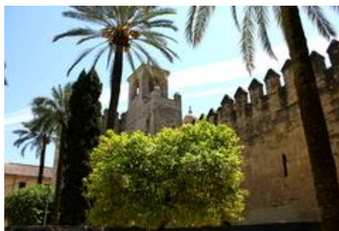
Slika 21. Alcazar katoličkih kraljeva

Dvorac je dobio ime po arapskoj riječi koja znači dvorac ili palača. Služio je kao jedan od primarnih rezidencija Isabelle I. Castille i Aragona Ferdinanda II.