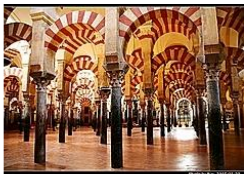
Slika 20. Velika džamija u Cordobi

Džamija je prošla nekoliko velikih faza obnove: Abdurahman III. je izgradio novi minaret, dok je Al-Hakim II., 961. godine uvećao plan građevine i izgradio novi Mihrab. Zadnju veću nadogradnju je uradio El-Mansur 987. godine.