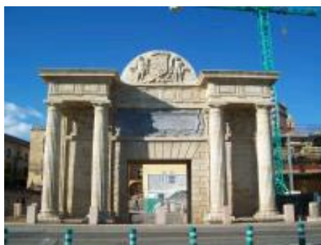
Slika 16. Puerta del Puente, Cordoba

Upisan je u UNESCO listu 1984. godine. Kordoba se nalazi na rijeci Guadalquivir, u podnožju planinskog vijenca Sierra Morena.