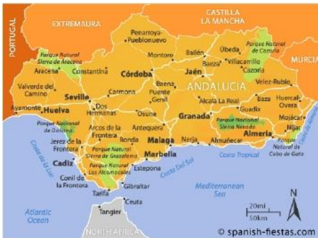
Karta 2. Turističko-geografski položaj Andaluzije

Turističko-geografski položaj može se definirati kao tradicionalno emitivna turistička žarišta i turističke regije kao tradicionalno receptivna područja. Andaluzijskih 836 km obale zapljuskuje Atlantski ocean na zapadu, gdje se nalazi Costa de la Luz (Obala svijetlosti - Huelva i Cádiz), i Sredozemno more na istoku, gdje se obala dijeli na Costa del Sol (Obala sunca - dio Cádiza i Málaga), Costa Tropical (Tropska obala - Granada i dio Almería) i Costa de Almería .