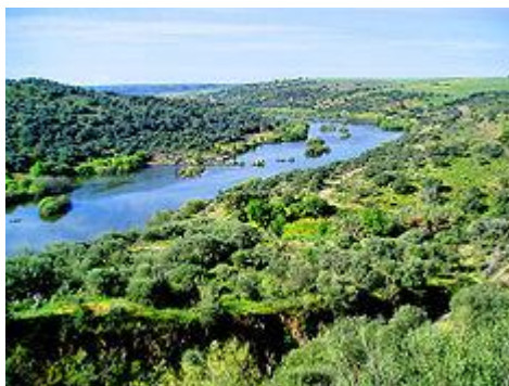
Slika 4. Guadiana

Guadiana je međunarodna rijeka koja se nalazi na Španjolskoj-Portugalskoj granici, razdvaja Extremaduru i Andaluziju (Španjolska) od Alenteksa i Algarve (Portugal). Rijeka je dobila naziv u Rimsko doba od latinske riječi " Flumen Anas ", što znači "Ona koja se odnosi na patke". Slijev rijeke se prostire od istočnog dijela Ekstramadure, preko južnih provincija Algarve do južnih dijelova San Antonia (Portugal) i Ajamonta (Španjolska), gdje se ulijeva u zaljev Cadiz. Sa tokom koji pokriva udaljenost od 829 km to je četvrta najduža rijeka na Pirinejskom poluotoku, a njen slijev se prostire na površini od oko 68.000 km 2 (većim dijelom u Španjolskoj).