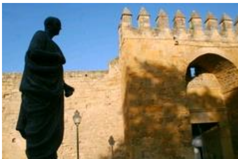
Slika 26. Židovska Cordoba ( Cordoba Judería )

sinagoga u cijeloj Andaluziji, koja je izgrađena u XIV. vijeku. Sinagoga je spomen židovskih teologa, filozofa i liječnika najpoznatijem židovskom filozofu Maimonidesu , autoru Mishneh Tore .