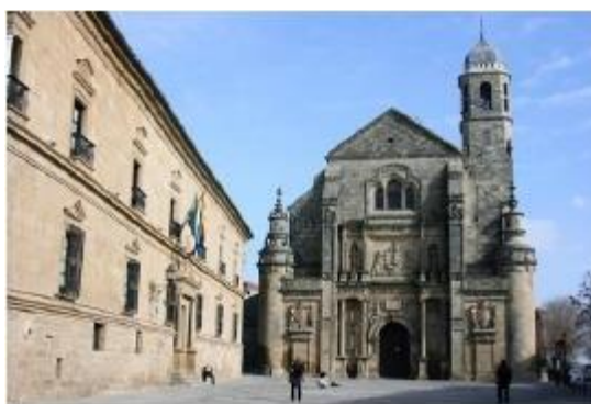
Slika 14. Ubeda

Upisan je na UNESCO listu 2003. godine. Ovi gradovi su nastali u IX vijeku, za vrijeme vladavine Mavara.