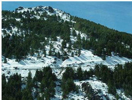
Slika 33. Sierra Nevada

Sierra Nevada je Andaluzijski planinski lanac poznat po najvećoj nadmorskoj visini u Španjolskoj, kao i po tome da je to najjužnije mjesto u Europi gdje je zastupljeno skijanje, i uopće sportovi na snijegu.