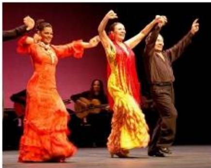
Slika 31. Flamenco