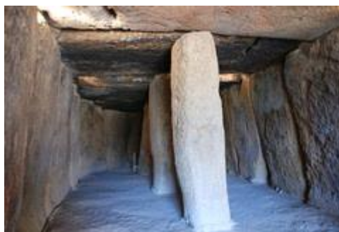
Slika 22. Dolmen de Meng

Dolmen de Meng je iz razdoblja 2.500 godina prije Krista. Sastoji se od hodnika i pristupnih grobnica koje su dobro ukopane na dubini od 20 metara. U unutrašnjosti prostora su formirani ogromni kameni blokovi i ploče koji dosežu težine i do 200 tona. Za kamene blokove dogonjen je kamen iz rudnika. Na površini je zemljani pokrov, koji je izvan grobnice. Grobnica je nepravilno ovalnog oblika. Na ulazu se vide i piktogrami. 20