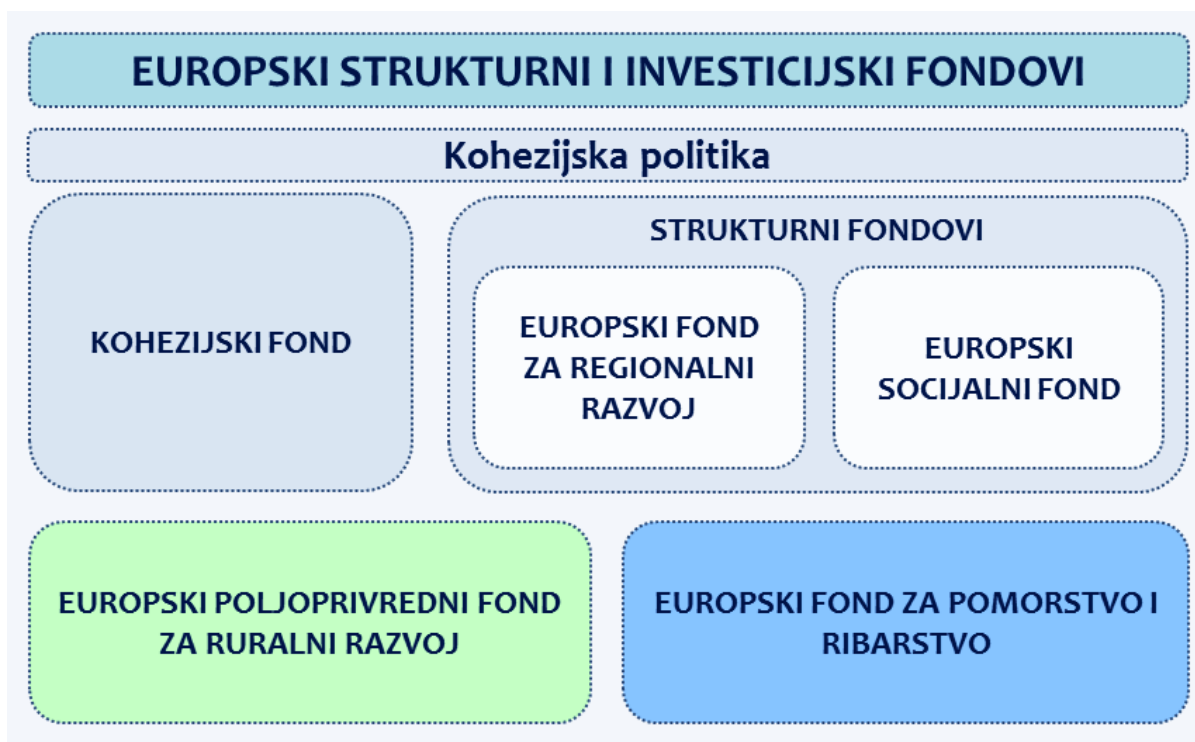
Slika 1: Shematiski prikaz Europskih strukturnih i investicijskih fondova