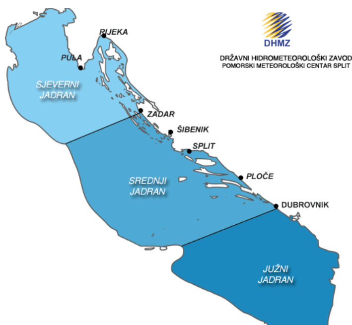
Slika 1: Geografska podjela Jadrana (DHMZ, 2017.)

More i obalni prostor najznačajniji su prirodno- geografski elementi za razvoj nautičkog turizma. Pritom, prirodno- resursnu osnovu razvitka nautičkog turizma čine (Dulčić, 2002.): prirodno- geomorfološke forme, kao reljef priobalnog prostora, hidrografske elementi, odnosno fizička, termalna i kemijska svojstva vode i klimatske osobine podneblja (temperatura zraka, oborine, vjetrovi, sunčanost/oblačnost i vlažnost zraka). Srednji Jadran, prema podjeli Državnog hidrometeorološkog zavoda obuhvaća područje od Zadra do Dubrovnika, te uključuje četiri županije: Zadarsku županiju, Šibensko- kninsku županiju, Splitsko- dalmatinsku županiju, te Dubrovačko- neretvansku županiju.