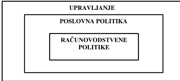
Slika 1. Odnos računovodstvene i poslovne politike

U cilju ostvarivanja poslovne politike nekog poduzeća jest primjena računovodstvene politike. Računovodstvene politike su važan instrument pri poslovanju i upravljanu poslovnim politikom. Odabir računovodstvene politike se uvijek treba temeljiti na ciljevima poslovne politike poduzeća.