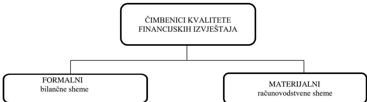
Slika 3. Čimbenici kvalitete financijskih izvještaja

Formalni sadržaj temelji se na sam oblik izvještaja. On se najčešće javlja putem predloženih ili propisanih bilančnih shema. Materijalni određuje vrijednost pozicija u već unaprijed određenim bilančnim shemama. S ovim informacijama dolazi se do zaključka da : „računovodstvene politike čine temeljnu komponentu kvalitete financijskih izvještaja“. 11