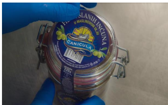
Slika 2: Prikaz proizvoda fileta slanih inćuna

Povijest tvrtke Canicula d.o.o. je jako duga i vodi nas do talijanske obitelji, nastanjenje u sicilijanskom gradiću Cefalu, prezimena Serio. Naime, prije nekih stotinjak godina obitelj Serio se počela baviti soljenjem i preradom morske ribe i morskih plodova, te je velikom požrtvovnošću i upornim radom tvrtka, danas poznata pod nazivom Pesce Azzuro postala liderom u proizvodnji konzervirane ribe u Italiji, a njihove je proizvode moguće naći na policama trgovina diljem svijeta i naravno Europske unije (Canicula d.o.o., 2017).