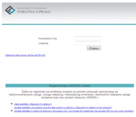
Slika 1. Union shema