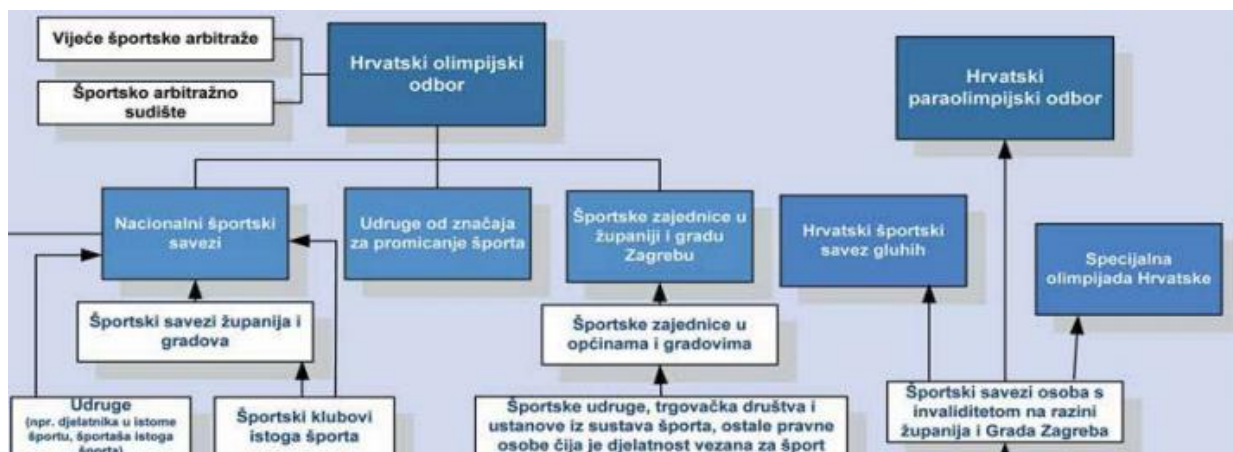
Slika 2: Organizacija i upravljanje sportom u Republici Hrvatskoj