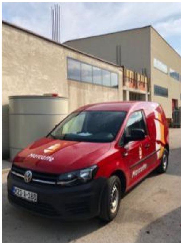
Slika br. 10: Marcaffé dostavno vozilo

Poduzeće svoje glavno predstavništvo ima u mjestu Draževići nedaleko od Sarajeva. Glavna i jedina proizvodnja kave se nalazi upravo na tome mjestu. Distribucija kave se vrši iz glavne proizvodnje. U poduzeću su zaposleni komercijalisti koji vrše distribuciju po terenima koji su im dodijeljeni. Komercijalisti izlaze svakodnevno na teren te dostavljaju proizvode krajnjim kupcima. Marcaffé poduzeće posjeduje 25 vozila putem kojih vrši transport robe.