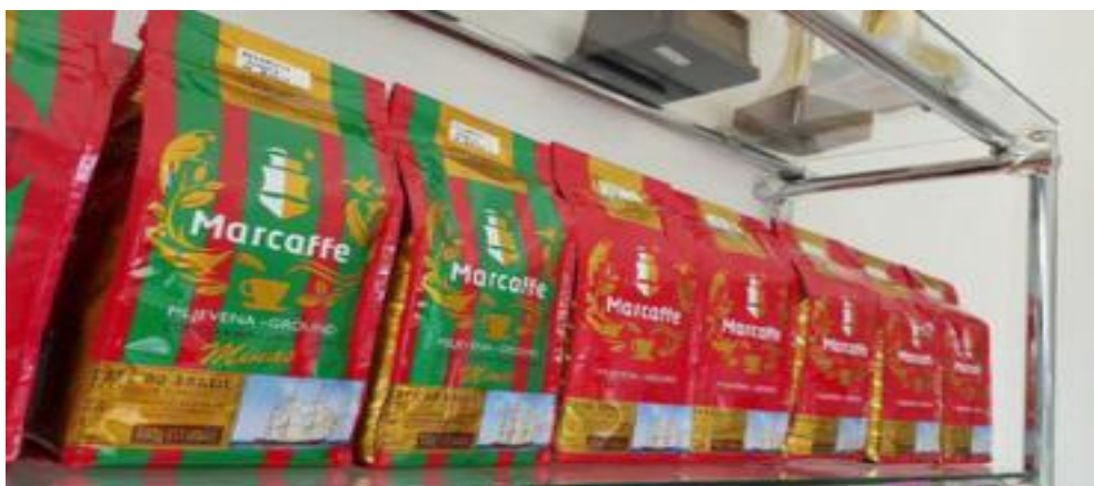
Slika br. 8: Marcaffè mljevena kava 500g (crveno i zeleno “tradicionalno” pakiranje)