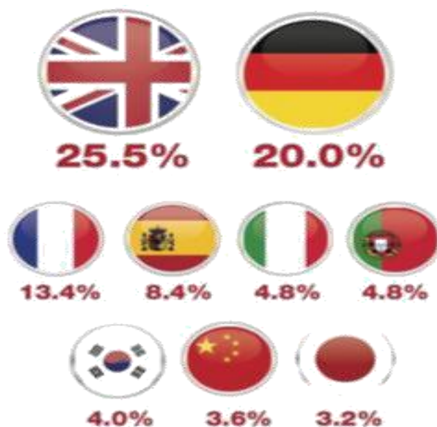
Slika br. 2: Prikaz zastupljenosti svjetskih jezika u obiteljskim poduzećima