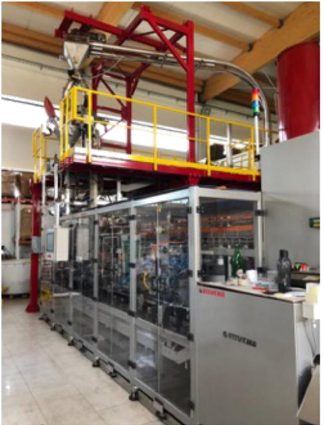
Slika br. 12: Novo postrojenje u poduzeću “Marcaffe”