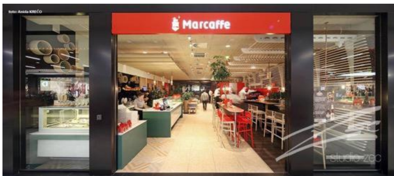
Slika br. 14: Marcaffè CoffeeShop Tuzla

Djelatnosti kojima se poduzeće bavi su primarno prodaja kave te prodaja instant napitaka. Pored toga, velik dio posla radi se i sa samouslužnim aparatim. Poduzeće snabdijeva kafiće, restorane i ostale uslužne objekte kojima daje svoje aparate za kavu, mlinove te reklamnu opremu. Proširenje djelatnosti dogodilo se unazad par godina kada je poduzeće otvorilo prvi kafić u Sarajevu, glavnom gradu Bosne i Hercegovine. Nakon njega uslijedilo je otvaranje istih u Tuzli te nakon toga i u Travniku. Svaki od ovih kafića nudi gostima mogućnost kupovine svih proizvoda u njima.