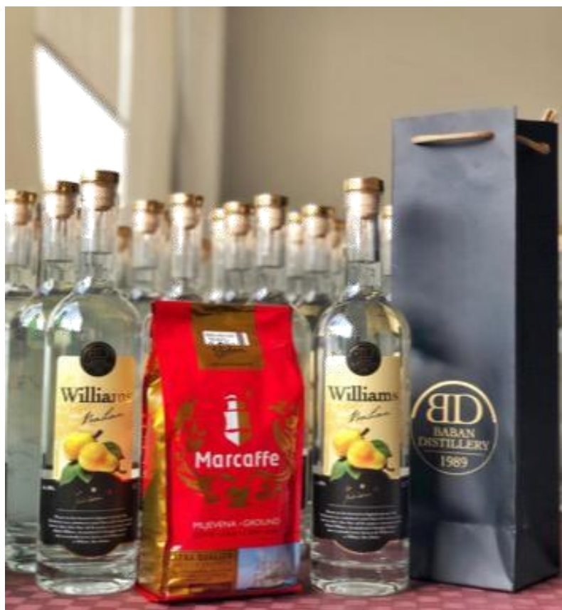
Slika br. 15: Marcaffè mljevena kava 500g te Williams Baban (voćna rakija)