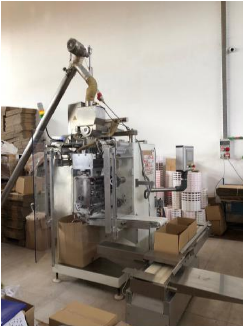
Slika br. 13: Stroj za pakiranje šećera

Osim najnovije opreme za pakovanje kave, tu su pakerice za pakovanje šećera kao i jedna od tehnološki najnaprednijih pakerica za instant napitke firme “Schmucker”.