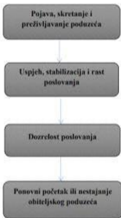
Slika br. 4: Prikaz životnog ciklusa obiteljskog poduzeća

Koncept životnog ciklusa obiteljskog poduzeća počiva na bihevioralnom pristupu koji svoje polazište životnog ciklusa ljudskih bića prenosi na prirodne i umjetne sustave. 14 Promatrano tako obiteljsko poduzetništvo prolazi kroz određene faze tokom svog postojanja. To su faze od rođenja poduzeća, do sazrijevanja i odrastanja, pa sve do smrti poduzeća. 15