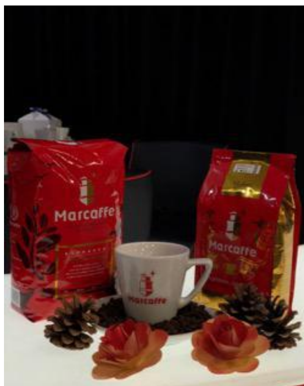
Slika br. 9: Marcaffè Espresso; Marcaffè mljevena kava 500g