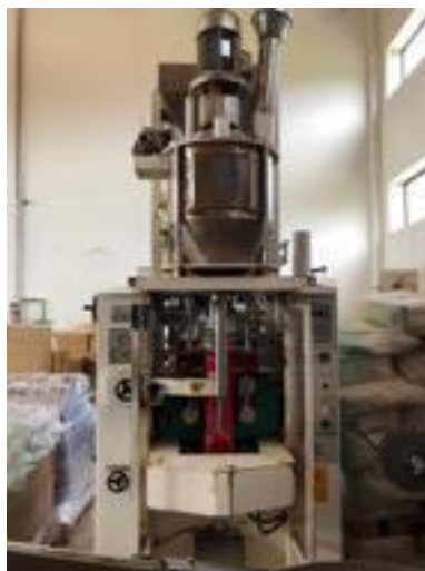
Slika br. 11: Stara pakerica za kavu

Sam proces od prženja sirove kave do krajnjeg proizvoda teče sljedećim tokom. Sirova kava se najprije prži u pećima, potom odlazi do mlina u kojem se melje. Putem transportera kava putuje sve do silosa u kojima stoji dok nije spremna za pakovanje. Kada je kava spremna za pakovanje, ponovno putem transportera odlazi do pakerice, gdje se na kraju dobiva gotov proizvod. U slučaju espresso kave, pečena kava odmah odlazi putem transportera u silos, gdje treba odstajati dan-dva te je nakon toga spremna za pakovanje.