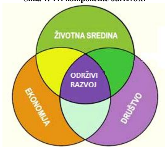
Slika 1. Tri komponente održivosti