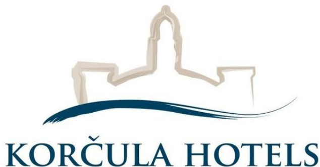
Slika 3. Logotip HTP Korčula