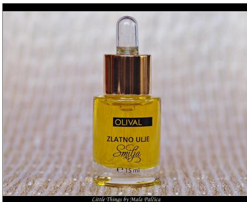
Slika 3. Ulje od smilja