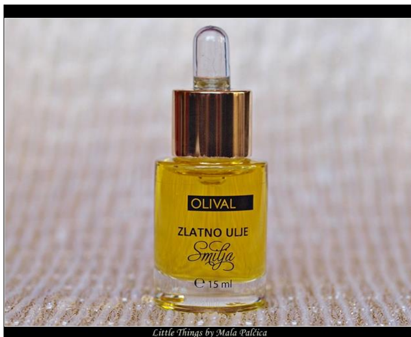
Slika 3. Ulje od smilja