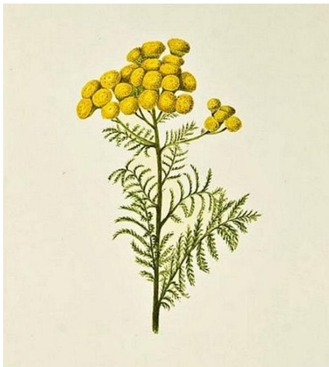
Slika 1. Biljka smilja