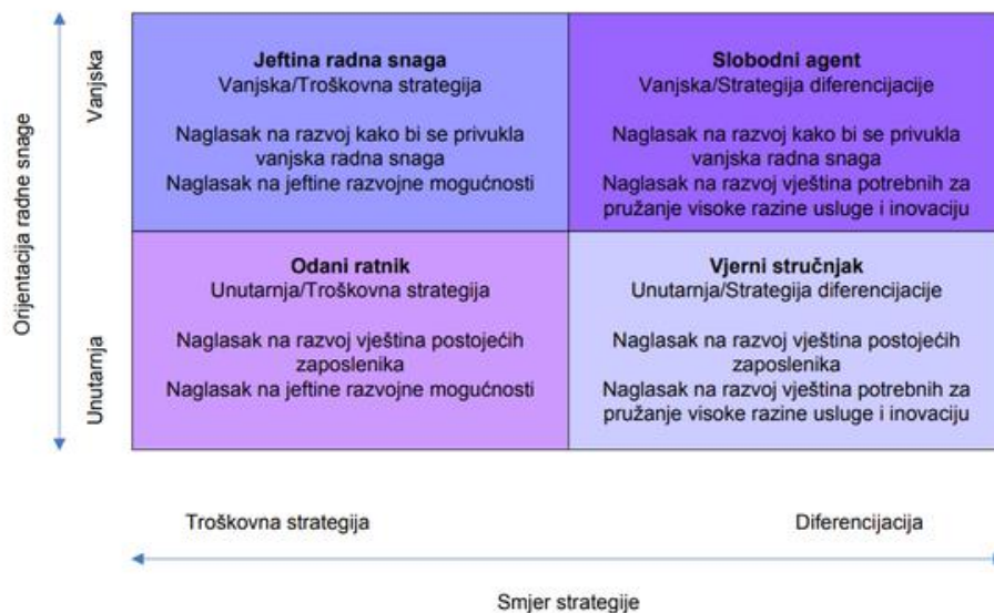
Slika 2. Strateški okvir za razvoj zaposlenih