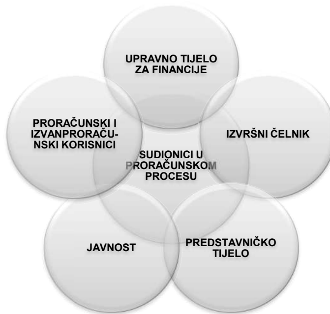
Slika 1. Sudionici u proračunskom procesu

gradu je to gradonačelnik. U prijedlogu proračuna predlaže sredstva za proračunsku zalihu koja se mogu koristiti za nepredviđene namjene, za koje u proračunu nisu osigurana sredstva ili za namjene za koje se tijekom godine pokaže da za njih nisu utvrđena dovoljna sredstva jer ih pri planiranju proračuna nije bilo moguće predvidjeti.