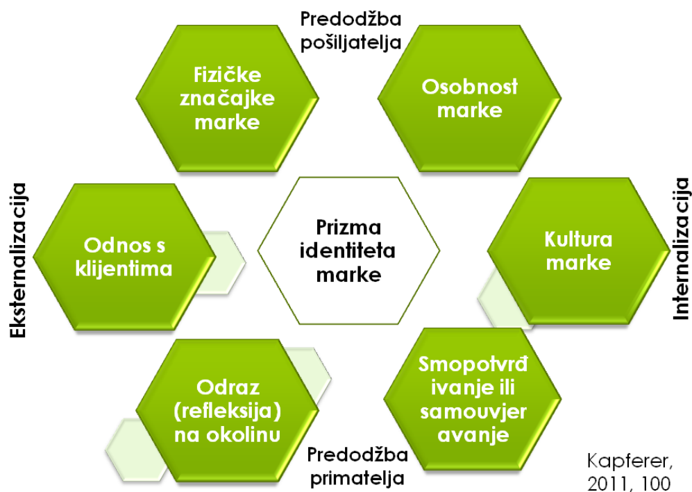
Slika 1. Prizma identiteta marke