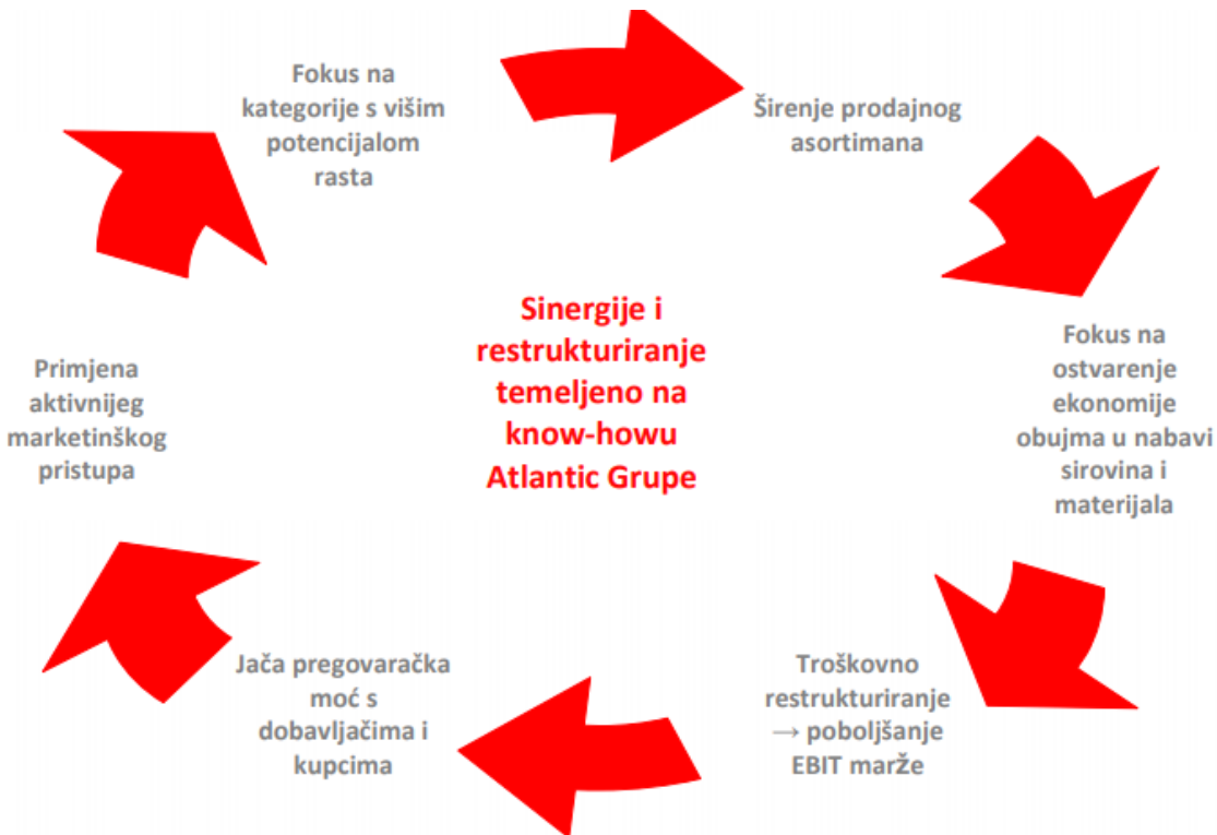
Slika 2.: Strateški razlozi za akviziciju Droga Kolinske