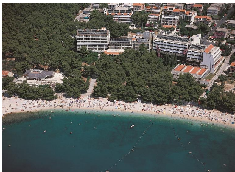
Slika 3: Prikaz lječilišta.

Nukleus Biokovke, datira još iz davne 1961. godine, kada je odlukom tadašnjeg Republičkog odbora Saveza RVIJ za Hrvatsku utemeljeno - Odmaralište RVI (ratnih vojnih invalida) Makarska, koje je započelo s radom 01. srpnja 1961. godine. Od tada pa do danas, to odmaralište mijenjalo je organizacijske oblike i nazive (Centar za liječenje, rehabilitaciju i odmor p.o. – 19. travnja 1983.g; Specijalna bolnica za medicinsku rehabilitaciju - 01. veljače 1994.g. – vlasnik postaje SDŽ; Specijalna bolnica za medicinsku rehabilitaciju, ali i za ugostiteljsku i turističku djelatnost - 20. svibnja 1996. godine). Biokovka je javna ustanova, registrirana za obavljanje više djelatnosti ali pretežito obavlja javno-zdravstvene usluge (liječenje i medicinska rehabilitacija, boravak i prehrana, liječenje za vanjske pacijente i sl.) te ugostiteljsko-turističke usluge (hotelske usluge, restoranske usluge, barske usluge, mjenjačnica, zakupi i sl.). U posljednjih nekoliko godina, prihod od ugostiteljsko-turističkih usluga ostvarenih na tržištu čini više od pola ukupno ostvarenog prihoda. 23