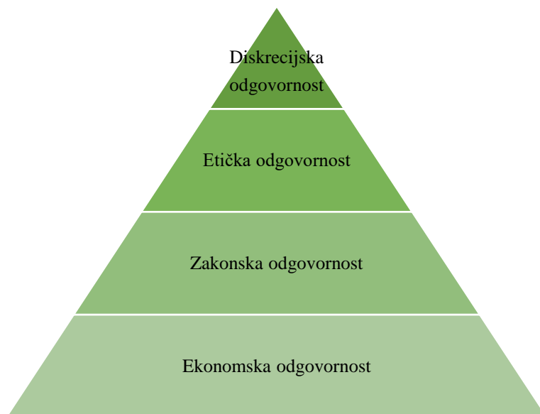
Slika 1: Piramida društvene odgovornosti, prema A. B. Carrollu

Gornji opisi predstavljaju početni Carrollov definicijski okvir o DOP-u, kojega je autor revidirao 1991. godine, sa svrhom pružanja detaljnijeg shvaćanja o diskrecijskoj odgovornosti. U ponovljenom pregledu ovog elementa, Carroll ističe njegovu filantropsku prirodu te sugerira da ta razina znači prisvajanje „korporativnog građanstva“ 22 . Nadalje, Carroll sažeto argumentira, da kako bi savjesna poslovna osoba mogla prihvatiti DOP, taj koncept mora biti uokviren na način da obuhvaća cijeli spektar poslovnih odgovornosti. Te poslovne odgovornosti mogu se kategorizirati u četiri već spomenute skupine, a koje se mogu prikazati u obliku piramide. 23