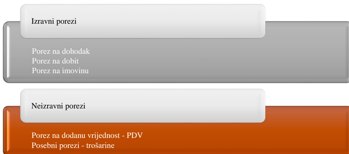
Slika 2. Glavni izravni i neizravni porezi na razini Europske unije

Oporezivanje predstavlja centralno pitanje nacionalnog suvereniteta zato što prihodi od poreza vladama osiguravaju novac potreban za opstanak i efikasno funkcioniranje. Porezni zakoni reflektiraju ključne odabire država članica Europske unije u važnim područjima javnih i privatnih rashoda. Oporezivanje može biti izravno i neizravno. Izravni porezi nameću se pravnim i fizičkim osobama, a neizravni porezi terete transakcije. 36 Slika 3 prikazuje glavne izravne i neizravne poreze na razini Europske unije. Prema tome, PDV pripada neizravnim porezima.