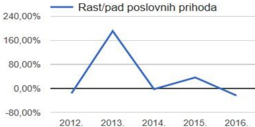
Slika 1. Kretanje poslovnih prihoda poduzeća Draga Sadra d.o.o., Sinj, u vremenu 2012. - 2016.

Ostalo razdoblje može se definirati kao učestalo i regulirano sa ne prevelikim oscilacijama. Kretanja su od nekih 50% pa sve do -30% otprilike što znači da poduzeće jako dobro regulira svoje rashode.