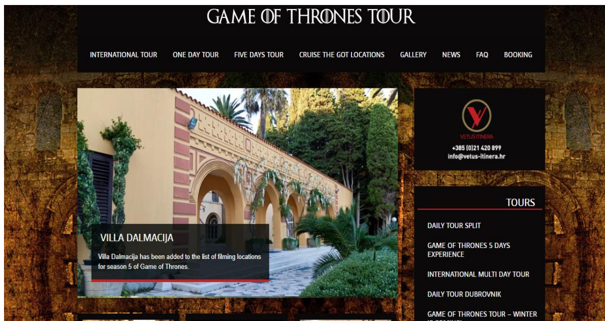
Slika 1. Web stranica Game of Thrones Tour

Vetus Itinera je receptivna putnička agencija koja je specijalizirana za izradu tailor-made putovanja u cijeloj Hrvatskoj. Cilj ove putničke agencije je predstaviti znamenitosti Hrvatske u inovativnom stilu, te stvoriti nezaboravno iskustvo svojim klijentima. Ponuda se temelji na prirodnim ljepotama i bogatoj povjesnoj i kulturnoj baštini. Nudi se široki izbor za sve one koji su u potrazi za avanturom, gastronomskim užicima kao i za parove koji traže romantičnu destinaciju za svoje vjenčanje. U ponudi su jedinstvene Game of Thrones ture koje obuhvaćaju sve lokacije snimanja te popularne serije na ovome području. Na posebnoj web stranici Game of Thrones se nalaze sve ture koje se organiziraju od strane Vetus Itinera kao i opisi putovanja, itinereri, te sadržaj putovanja.