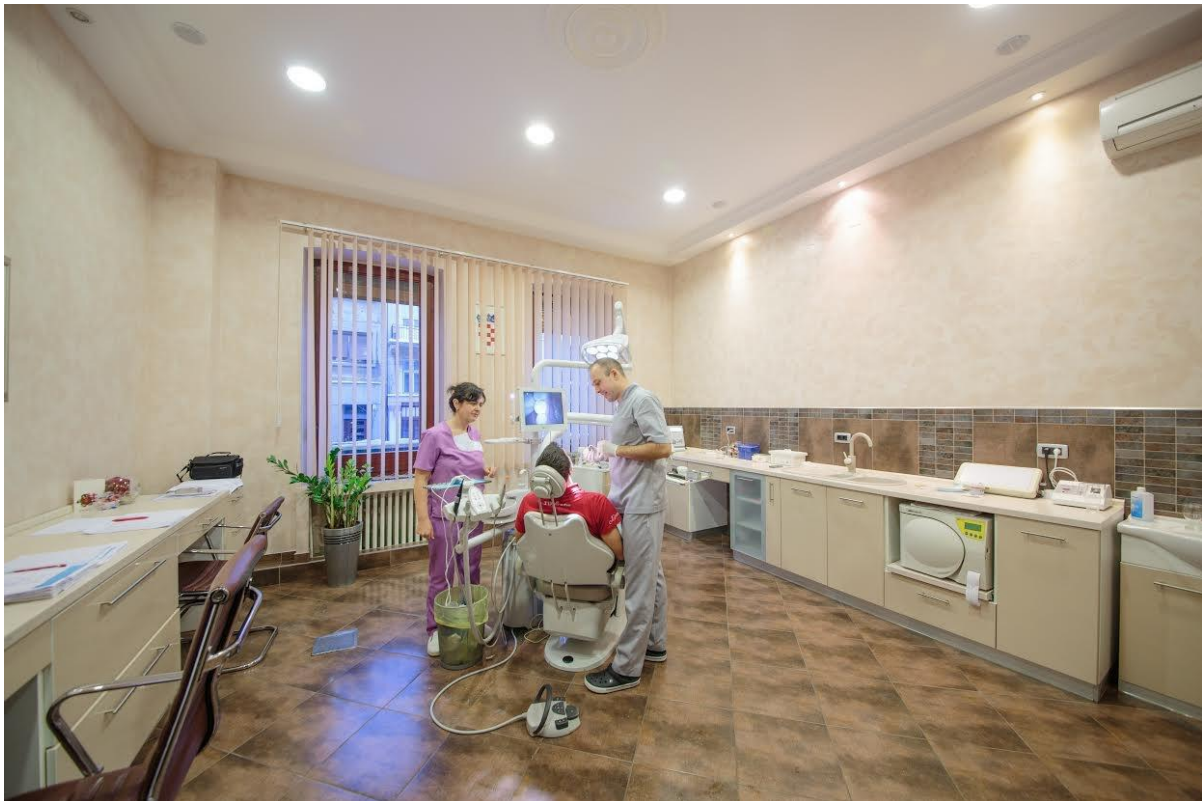
Slika 4: Ordinacija Dental centar Čes

Uz rast poslovanja, tim se uskoro proširio na 20 osoba, a budućnost izgleda sjajno. "Svake godine širimo i kupujemo novu opremu", kaže Josip, "U konačnici, naš cilj je da se vaše ideje i želje i - uz pomoć naše stručnosti i tehnologije - pretvorimo u svijetlo osmijeh!" 94