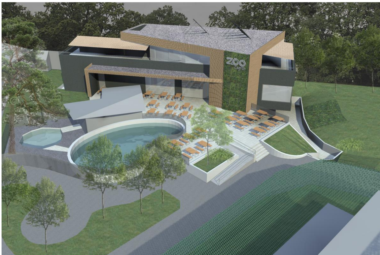
Slika 3: Vizualizacija ZOO Zagreb nakon modernizacije

čak 95%, odnosno 35.960.675,88 kn, financiralo se sredstvima Europskog fonda za regionalni razvoj . 90