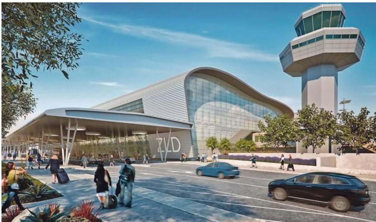
Slika 2: Vizualizacija projekta „Zračna luka Dubrovnik“