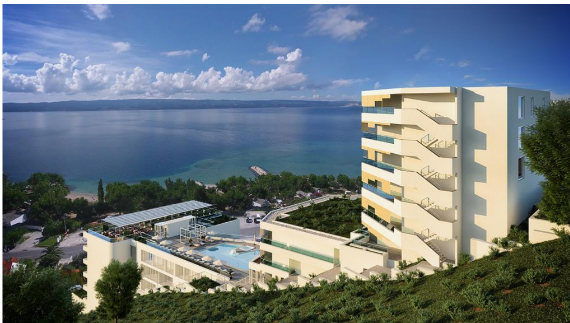
Slika 5: Hotel Plaža Duće