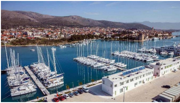
Slika 5. Marina Trogir