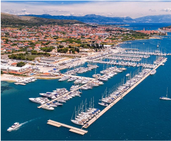
Slika 3. Marina Baotić