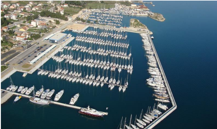
Slika 6. Marina Kaštela