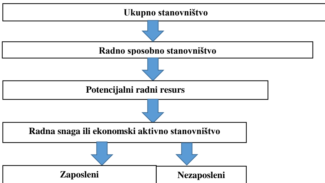
Slika 1: Ekonomska struktura aktivnoga stanovništva