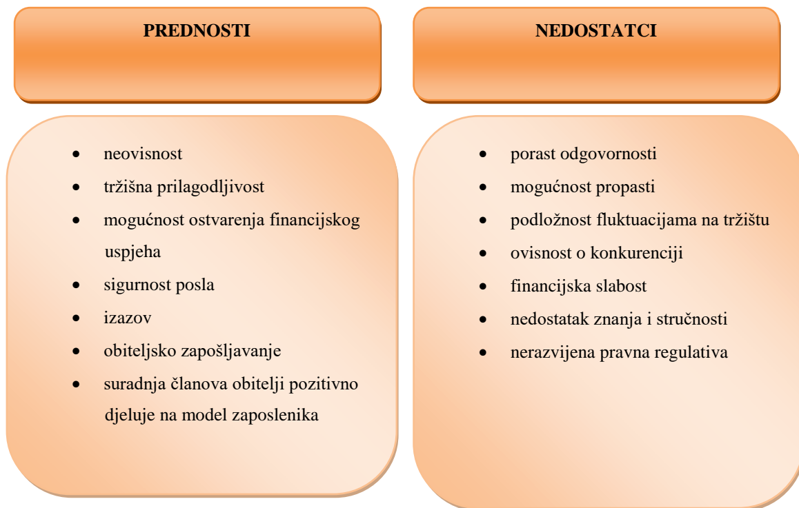
Slika 2: Prednosti i nedostaci malih poduzeća

Prednosti malih poduzeća su brojne, kao i njihovi nedostaci. Prednosti i nedostaci prikazani su na slici 2.