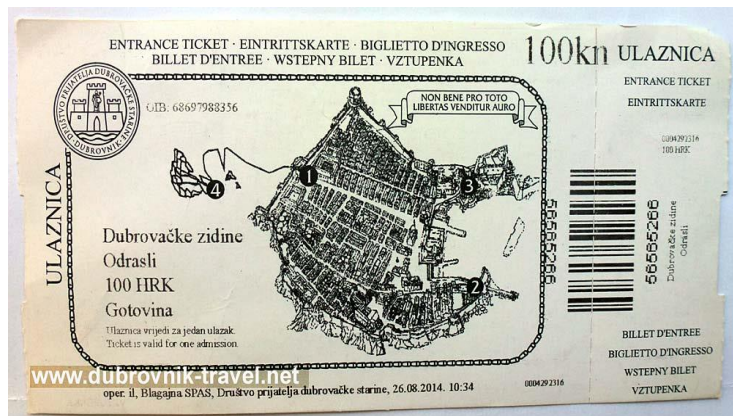
SLIKA 4: Ulaznica za gradske zidine

Okruženje u kojem se dostavlja usluga razgledavanja zidina grada Dubrovnika je jedinstveno te nijedan posjetitelj neće ostati ravnodušan. Dubrovačke zidine su savršeno mjesto za šetnju i fotografiranje te se upravo iz toga razloga ponekad stvaraju gužve jer posjetitelji nekad žele