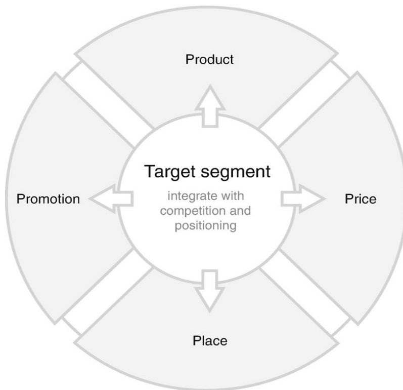
Slika 1. Marketinški mix

Sljedeća slika prikazuje osnovne elemente marketing mixa, poznatog i kao 4P, a uključuje proizvod, cijena, promocija, distribucija (engl. place ).