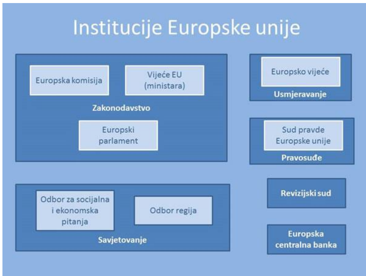
Slika 1: Institucije Europske unije