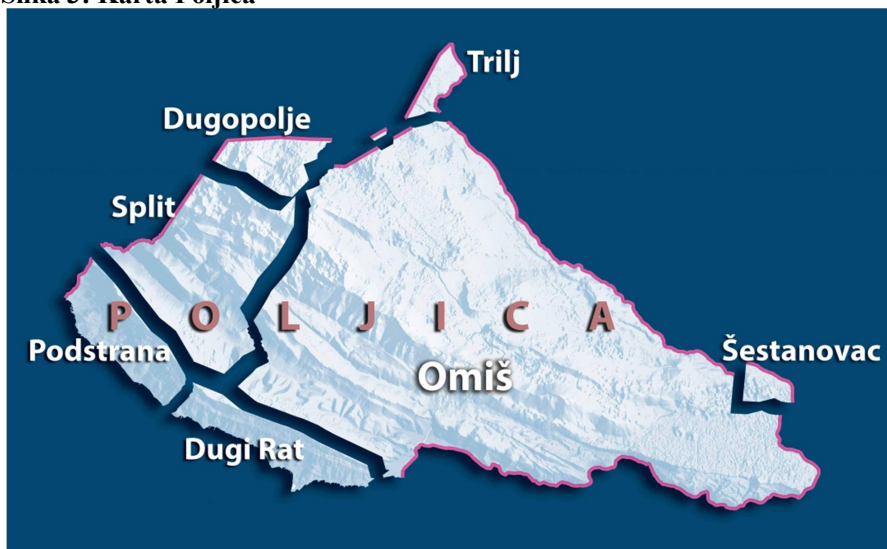
Slika 3: Karta Poljica