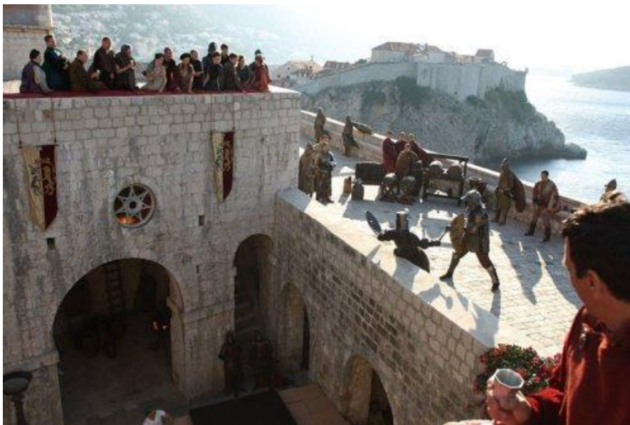
Slika 1. Tvrđava Lovrijenac (Dubrovnik) – Red Keep (King's Landing)

Od 2011. do 2013. godine, Hrvatska je bila u centru pažnje zbog snimanja uspješnice HBO-a „Igra prijestolja“. U Dubrovniku su snimane tri sezone, a 2014. godine se, u četvrtoj sezoni, lokacijama snimanja pridružio i Split te atraktivni zakutci Dioklecijanove palače. U drugoj i trećoj sezoni Dubrovnik je korišten za jednu od najvažnijih lokacija u seriji – prijestolnicu Sedam Kraljevstava Kraljev grudobran (King's Landing). Serija se snimala na nekoliko lokacija u okolici Dubrovnika, kao što su Lokrum i tvrđava Lovrijenac. Popularnost serije u Hrvatskoj se ne zaustavlja 2014. godine, već i dalje raste u narednim godinama. Snimanje u Hrvatskoj održava se u organizaciji hrvatske tvrtke Embassy Films. Treću sezonu ove serije je pratilo oko 14 milijuna gledatelja i druga je najgledanija HBO-ova serija nakon „Obitelji Soprano“. Na tražilici Google je termin „Game of Thrones Croatia“ tražen više od 1,5 milijuna puta. O snimanju u Hrvatskoj su govorili Daily Mail, USA Today, CBS News, Sky, Telegraph, Huffington Post i mnogi drugi. Međutim, Hrvatska još uvijek nije iskoristila taj skriveni marketinški potencijal za promociju vlastite turističke ponude već sve ostaje na pokušajima lokalnih turističkih djelatnika i privatnih turističkih agencija. 43