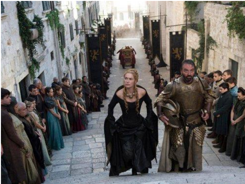
Slika 3: Barokne stepenice (Dubrovnik) – Stairs to the Great Sept of Baelor (King's Landing)

Minčeta je najsjevernija i najmonumentalnija tvrđava na dubrovačkim gradskim zidinama; najistaknutija točka obrambenog sustava Dubrovnika prema kopnu. Uz sv. Vlaha, svojevrsan je simbol grada Dubrovnika.