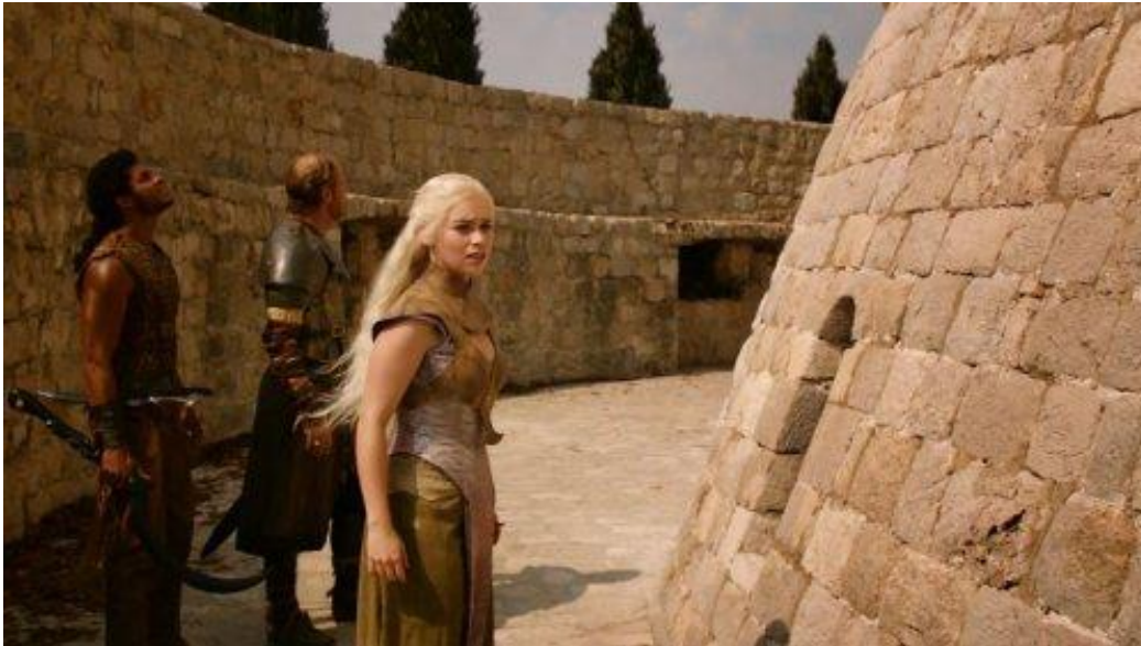
Slika 2: Toranj Minčeta (Dubrovnik's Wall) – House of the Undying

Tvrđava Lovrijenac, također poznata kao Gibraltar Dubrovnika, tvrđava je koja se nalazi na hridi izvan vanjskih zidina sa zapadne strane Dubrovnika, 37 m iznad razine mora.