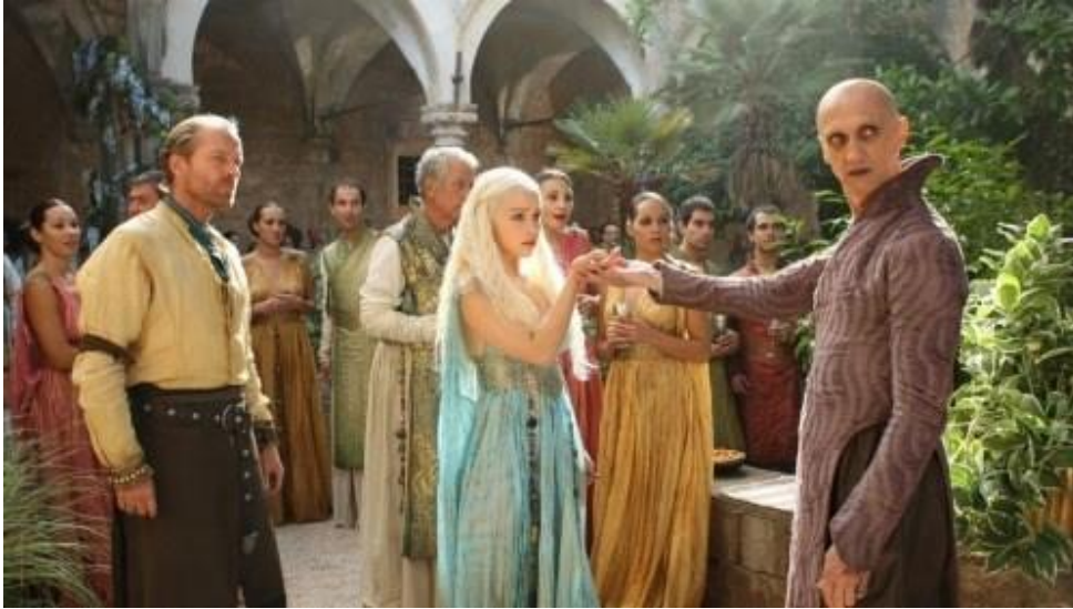
Slika 4: Otok Lokrum u seriji poznat kao Qarth

Šeststo metara od kopna nalazi se grad Qarth, inače poznat kao otok Lokrum. Ovo je mjesto gdje Daenerys Targaryen dobiva hladnu dobrodošlicu od Spice kralja.