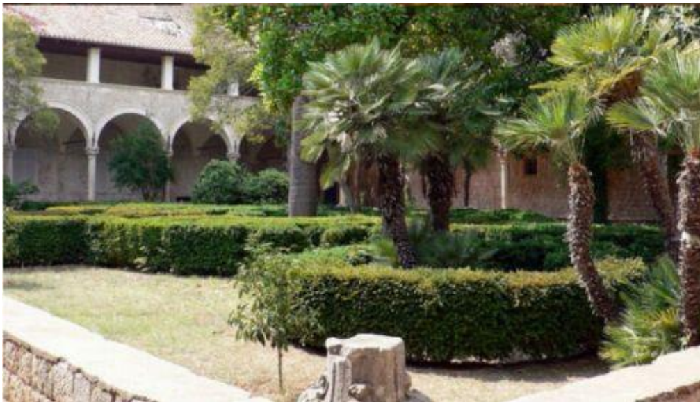
Slika 5: Otok Lokrum u seriji poznat kao Qarth