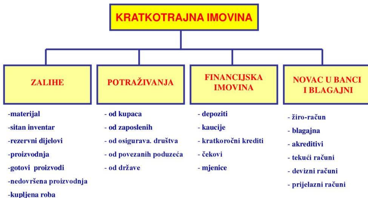
Slika 2: Detaljna podjela kratkotrajne imovine