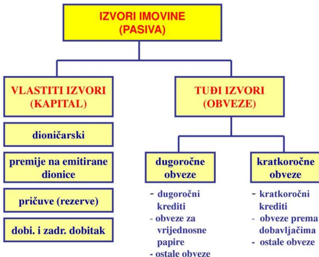
Slika 3: Detaljni prikaz podjele pasive