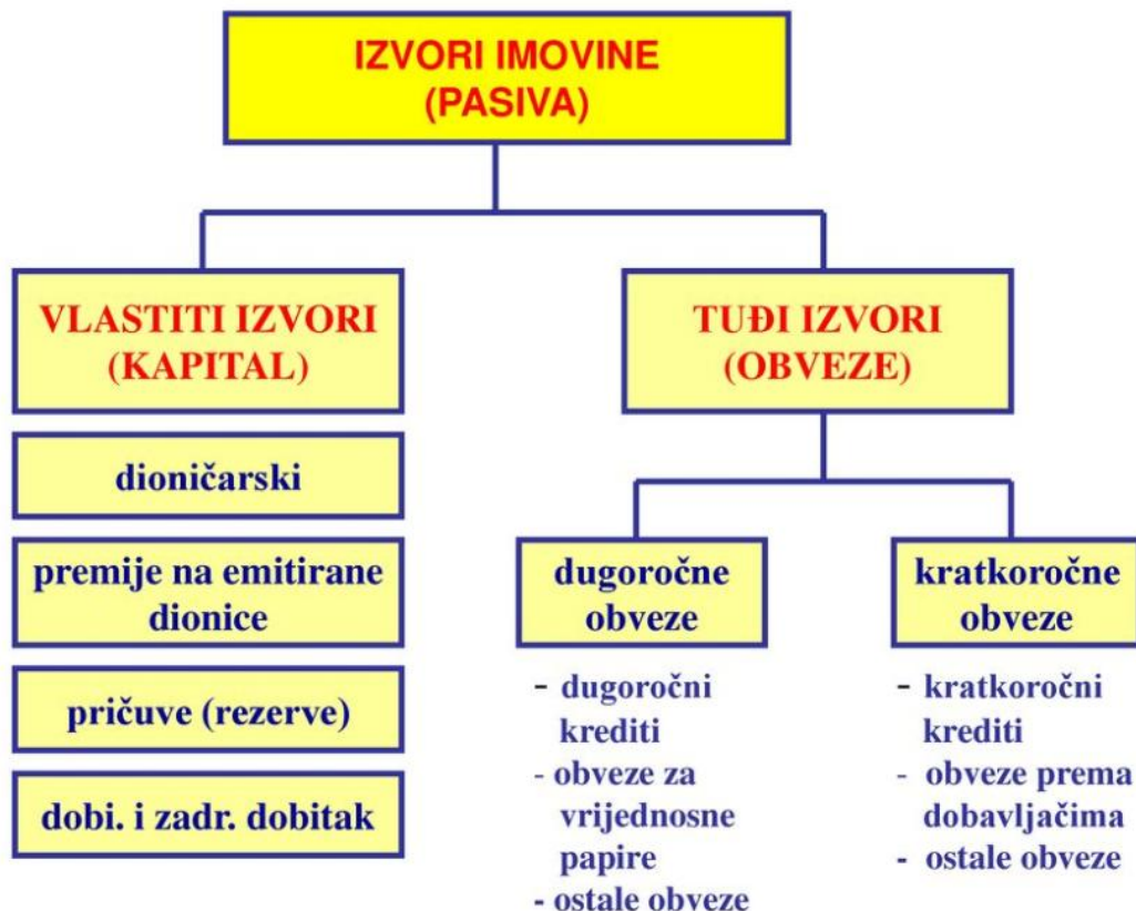
Slika 3: Detaljni prikaz podjele pasive