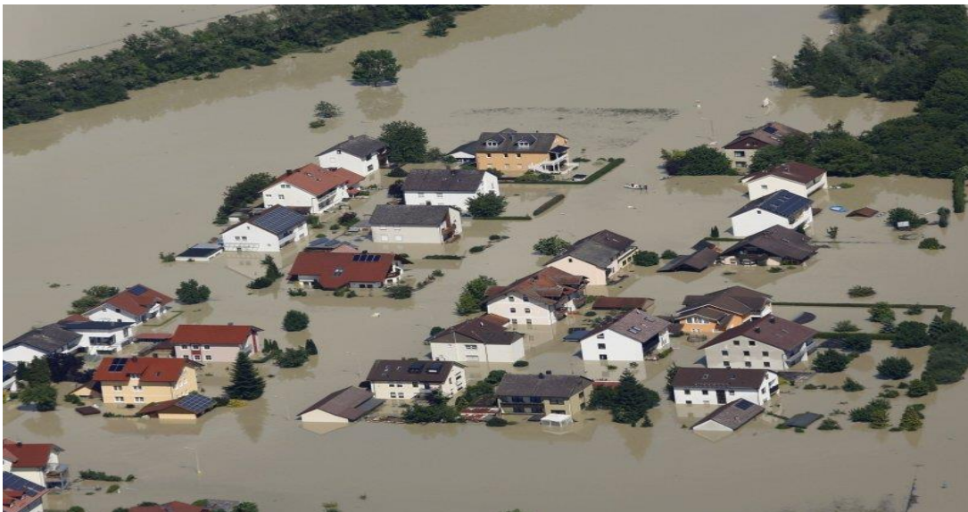
Slika 1. Vodeni val u Njemačkoj

u odnosu na brojke iz prošlih godina. Ukupno su dolasci turista u Saksoniju za 2002. godinu smanjeni za 362 tisuće, što je više od 8%. Za grad Dresden se gubici iz turizma procjenjuju na 164,3 milijuna eura. Svijest o krizi među onima koji su odgovorni za turizam je bila vrlo niska. Općenito su smatrali da su turističke krize u drugim regijama svijeta vjerojatnije i normalne, ali su odbili prihvatiti da se iste mogu pojaviti i u području njihove odgovornosti. Upravo iz tih razloga nisu postojale procedure za upravljanje krizama. Prevladavalo je stajalište da se krize mogu rješavati samo spontano i kroz improvizaciju, ali ne uz pomoć mjera prevencije. Iz tog razloga, ali i zbog ograničenog financijskog i osobnog prostora za upravljanje turističkih organizacija, njihove su preventivne mjere još uvijek ograničene na zakonske obveze za vlastite organizacije (npr. protupožarna zaštita i planovi bijega), dok planovi za turističke krize viših razina još uvijek nedostaju. Ipak, zahvaljujući vlastitoj inicijativi, suradnji, kreativnosti, financijama, preraspodjelom i sponzorstvom, mogli su pokrenuti različite aktivnosti za oporavak. Na taj način, turizam u Saksoniji nakon godinu dana dosegao je razinu dolazaka turista prije krize. 16