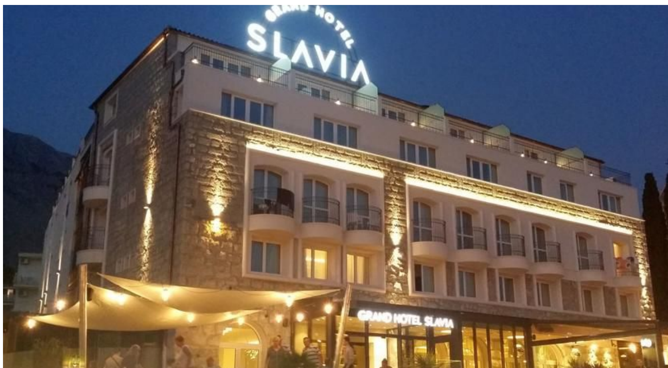
Slika 3. Hotel Slavia, Baška Voda

Misija studije je bila: Profesionalnošću, uslužnošću i inovativnošću koja se oslikava kroz pristup naših ljudi - pružiti svakom gostu jedinstveni osjećaj dobrodošlice i pripadnosti pružajući svakim susretom najvišu kvalitetu usluge.