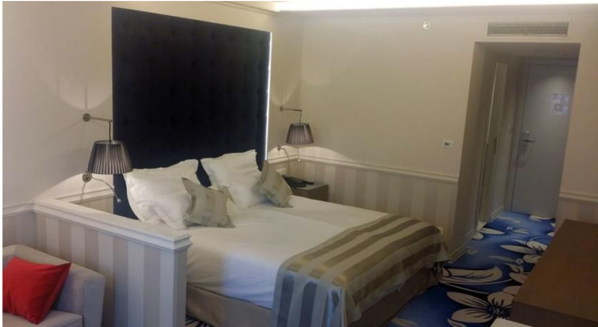
Slika 4. Soba u hotelu Slavia, Baška Voda

Danas hotel broji 72 sobe i apartmana, od kojih većina ima pogled na more. Sve sobe opremljene su prema posljednjim standardima. Svaka soba ima besplatan parking, Wi-fi, TV s kabljskim programima, mini bar, klima. Kupaonice su opremljene tušem ili kadom, besplatnim kozmetičkim priborom i sušilom za kosu.