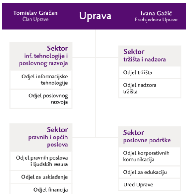
Slika 1. Organizacija Zagrebačke burze