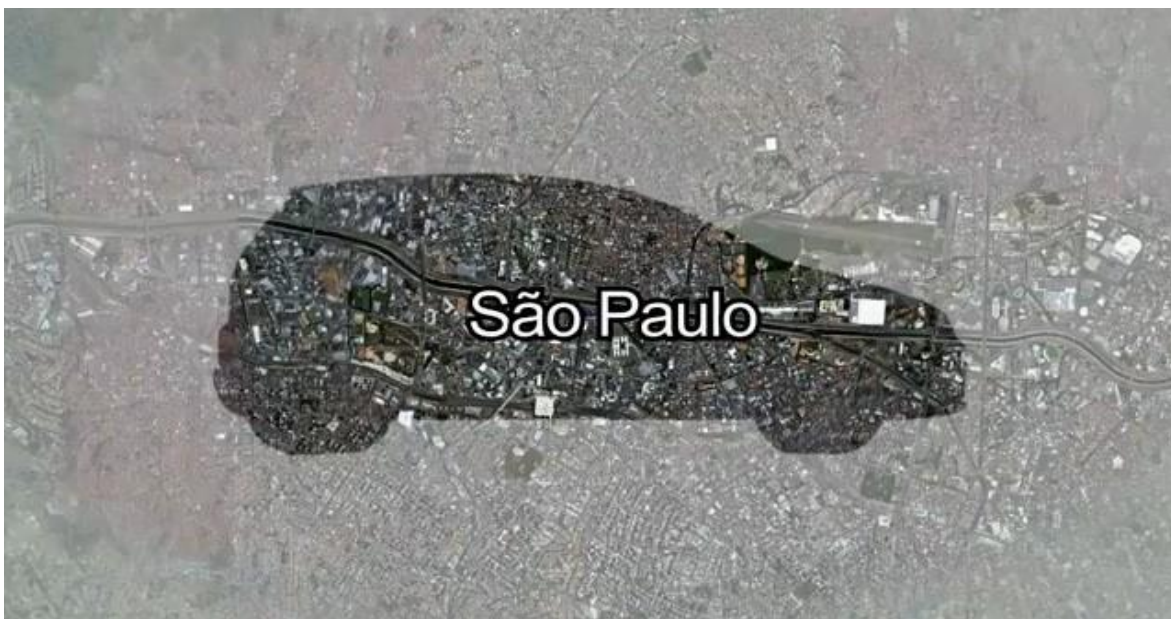
Slika 2: Primjer oglasa Volkswagena na Twitteru

Izvor: virtualna tvornica, http://www.virtualna-tvornica.com/marketing-na-drustvenim-mrezama/