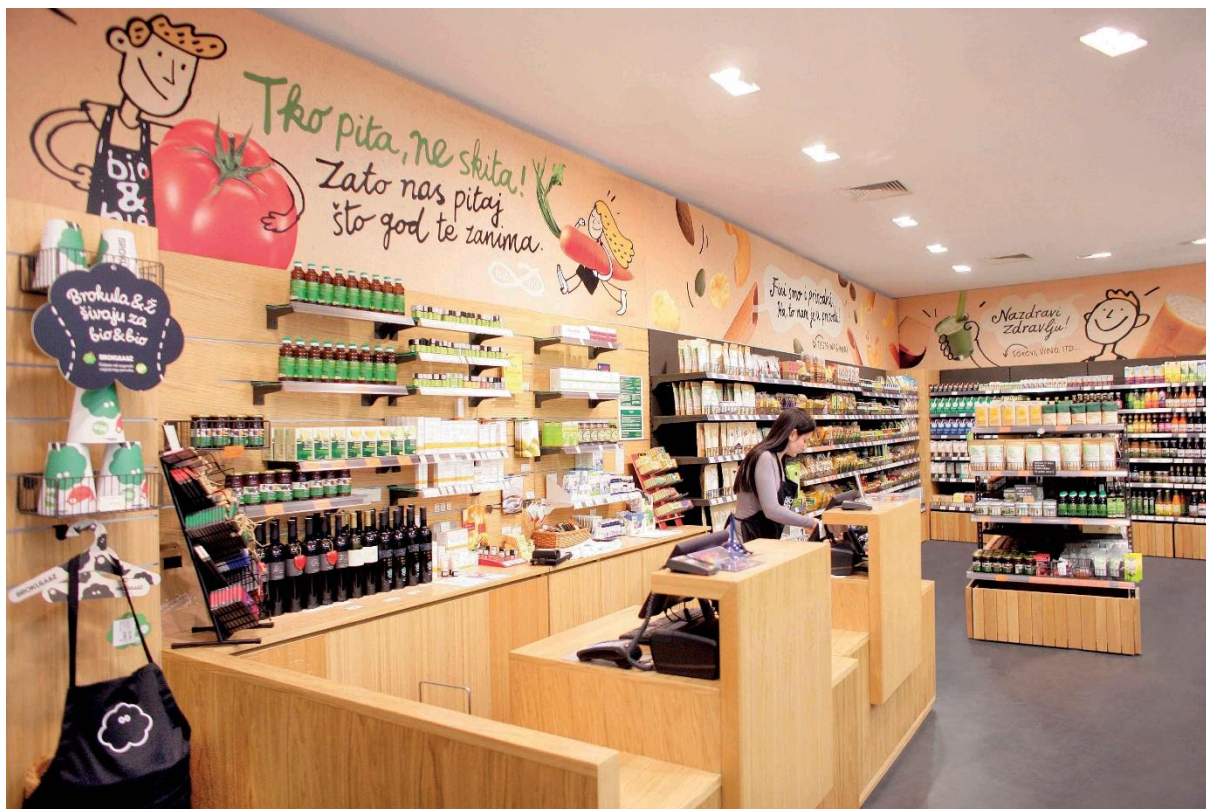
Slika 2: izgled Bio&Bio prodavaonice