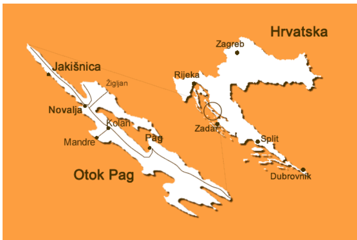
Slika 1: Zemljopisni položaj otoka Paga

Vrlo dobar zemljopisni položaj te vrhunska prometna povezanost pomaže da ispuni svoji svoj turistički potencijal. U usporedbi s drugim otocima na Jadranu, otok Pag sigurno spada u one otoke do kojih se najlakše može doći, što je veoma bitan faktor za mnoge strance koji odluče posjetiti ovaj dio Mediterana.