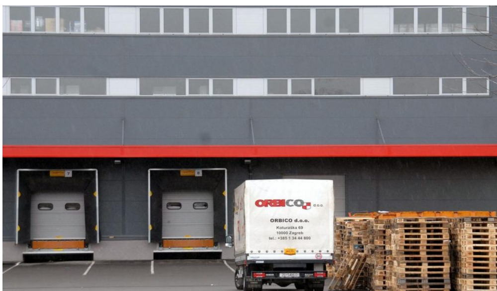
Slika 9: Orbico dostavni kamion