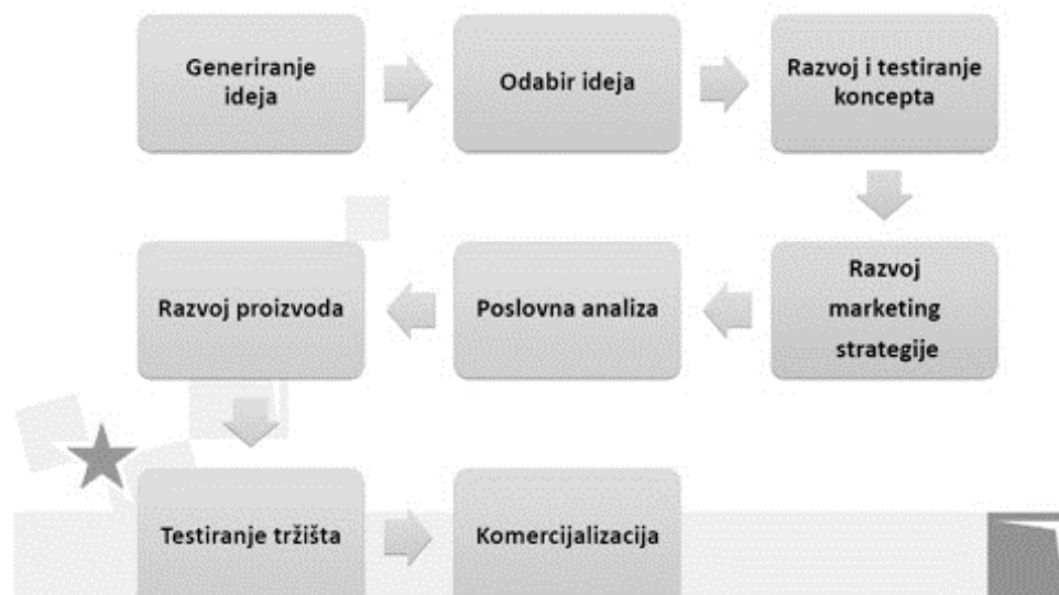
Slika 2. Proces uvođenja novih proizvoda

Izvor: Kotler, P., Amstrong, G. (2016): Principles of Marketing 16/e, Šerić, N., (2016): Upravljanje proizvodom