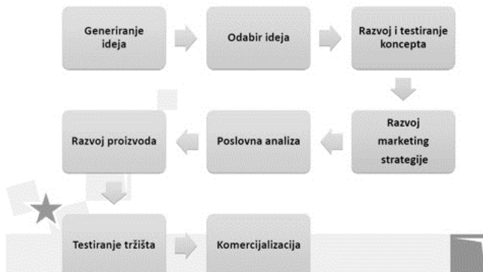
Slika 2. Proces uvođenja novih proizvoda