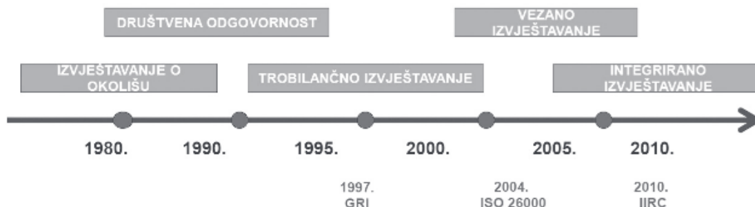
Slika 2: Razvoj nefinancijskog izvještavanja