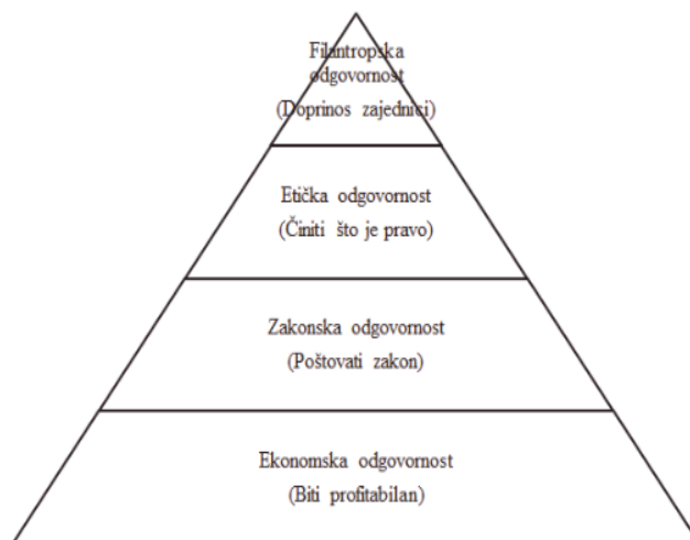
Slika 1: Carrolova piramida

Prema Carrolovoj piramidi postoje četiri vrste odgovornosti DOP-a.