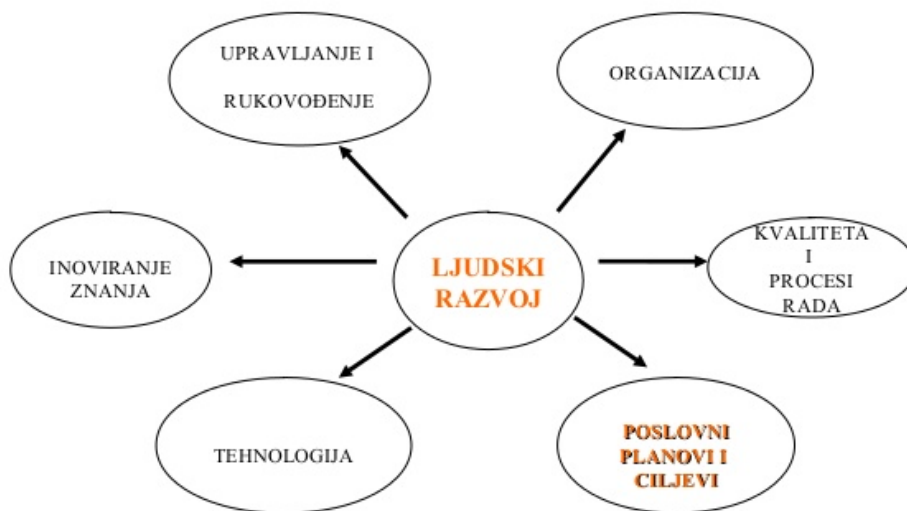
Slika 1.: Utjecaj suvremenih ljudskih resursa

Poanta je da će prilikom procjene u svrhu primjerice nagrađivanja i/ili napredovanja u slučaju tvrdog upravljanja ljudskim resursima biti izabran najbolji radnik, a u slučaju mekog upravljanja ne nužno najbolji radnik u nadi da će se on u (bližoj) budućnosti razviti. Danas je situacija takva da sve više organizacija tvrdo upravlja ljudskim resursima, posebno kad je riječ o privatnicima, dok su javna poduzeća više-manje okrenuta mekom upravljanju. Važno je naglasiti da do nedavno nisu ni postojali odjeli ljudskih potencijala unutar organizacija, već „kadrovska služba“ koja se bavila uglavnom zapošljavanjem i plaćama. Međutim, danas HR odjeli imaju puno više funkcija i igraju znatno veću ulogu nego što je to bio slučaj s kadrovskom službom. 8