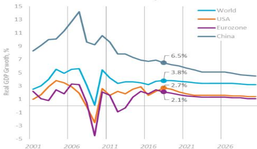
Real GDP Growth in the World's Major Economies: 2001-2030

Source: Euromonitor International's Macro Model Note: Data labels show forecast values for 2018.