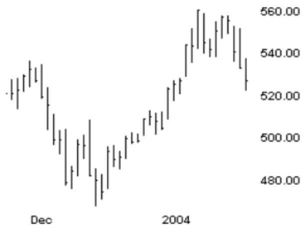
Grafikon 2 : Histogram – Bar chart