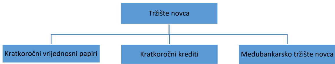
Slika 2. Sastavnice tržišta novca