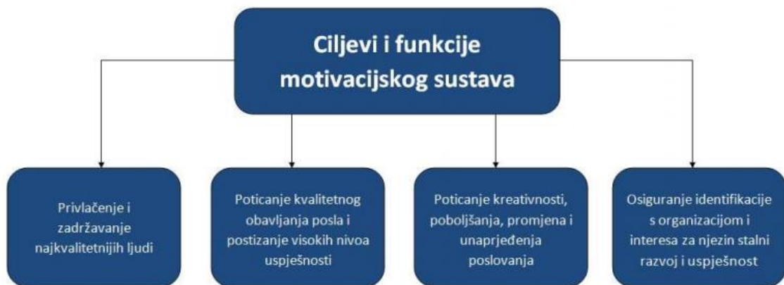
Slika 1. Funkcije i ciljevi motivacijskog sustava

Izvor: Sikavica, P., Bahtijarević-Šiber, F., Pološki-Vokić, N. (2008). Temelji menadžmenta, str. 562.