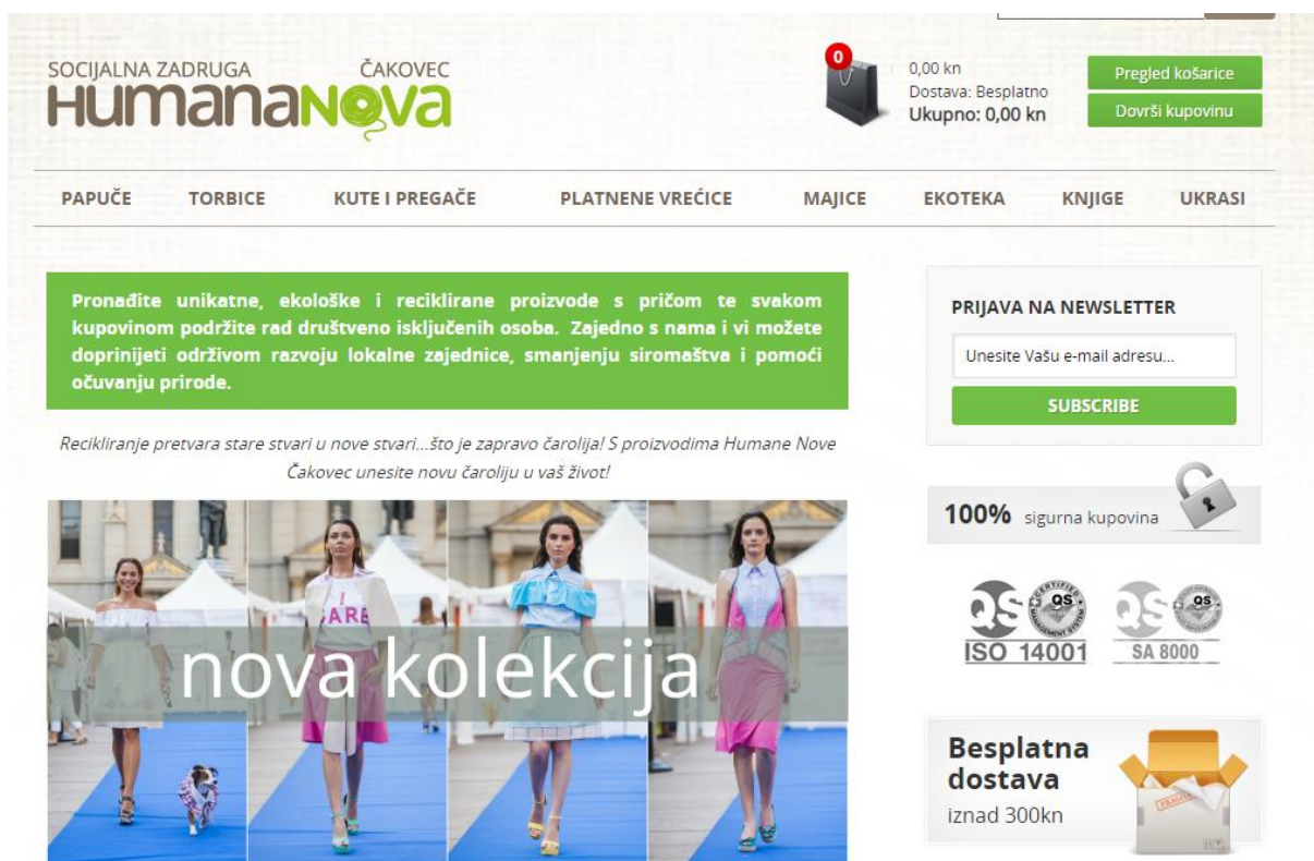
Slika 8: Web shop socijalne zadruge Humana Nova