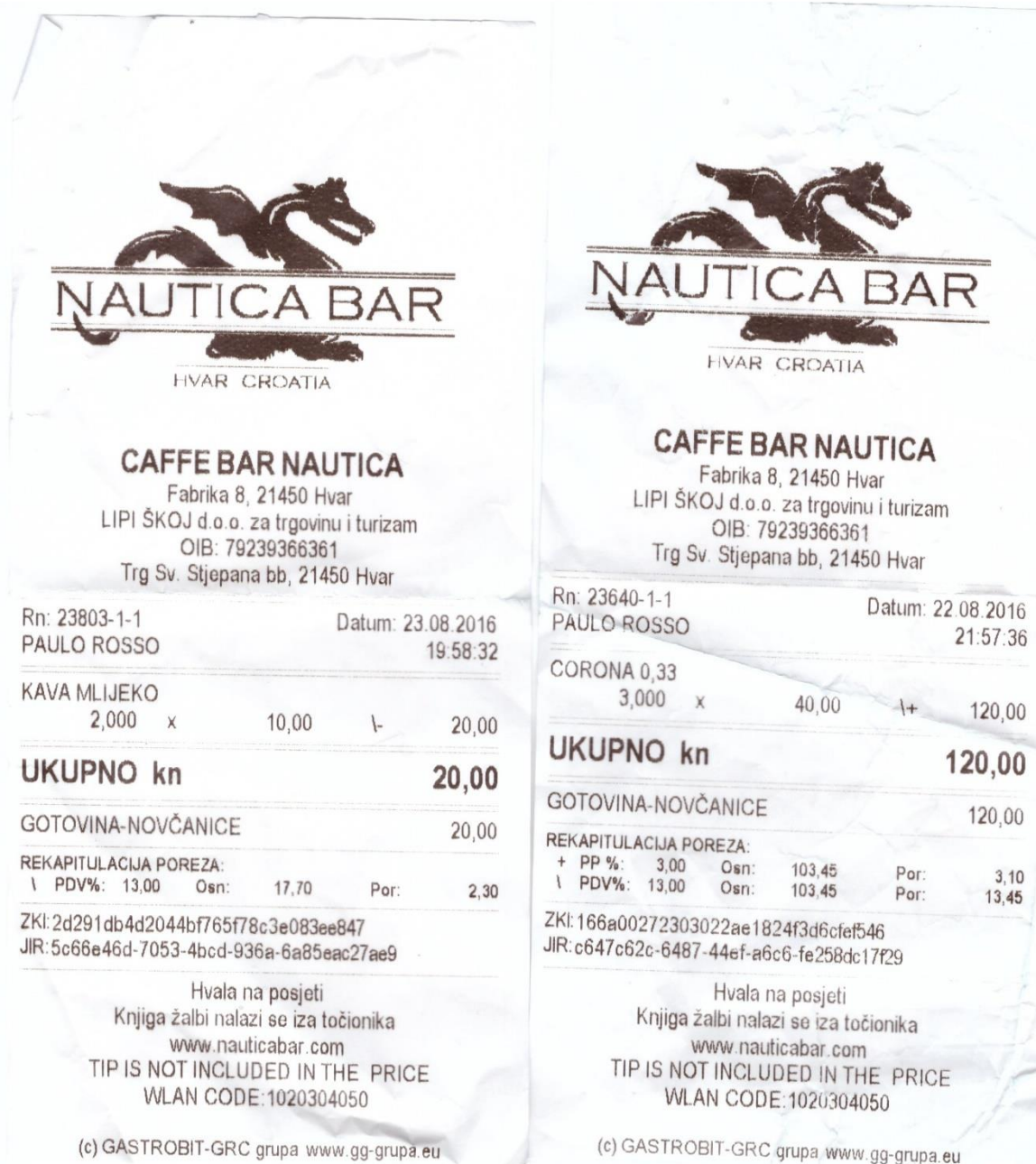
Slika 3: izlazni računi

Kod ugostiteljstva se obračunava porez na potrošnju i PDV po različitim poreznim stopama. U sljedećim primjerima ćemo pokazati koji artikli podliježu porezu na potrošnju i po kojoj poreznoj stopi.